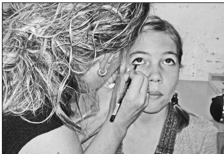
Ramona «in der Maske».