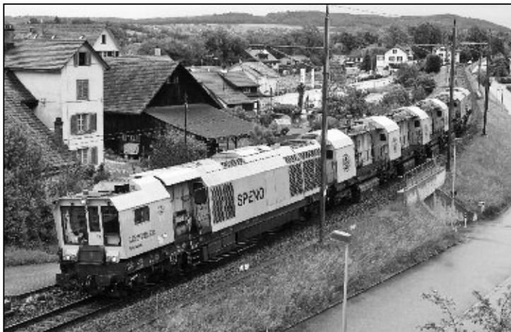
Der 6-teilige Schienenschleifzug verrichtet mit Getöse seine Arbeit.

wohl viele Leute in Erstaunen. Ein langes gelbes feuerspeien- des Vehikel, einem modernen Lindwurm ähnlich, fuhr ge-