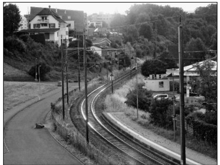
Der letzte Sonnenstrahl lässt die Schienen glöhnen.