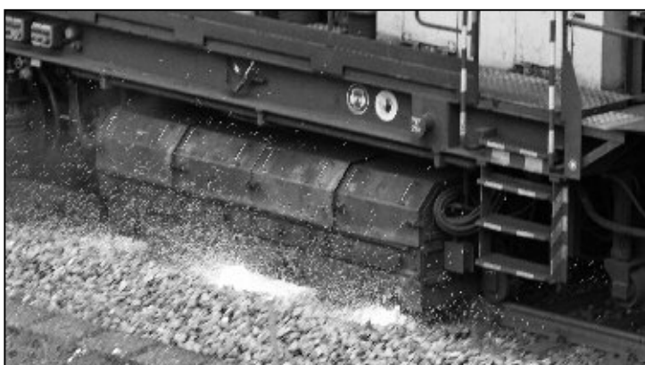
Das Schleifelement versprüht weissglühende Funken.