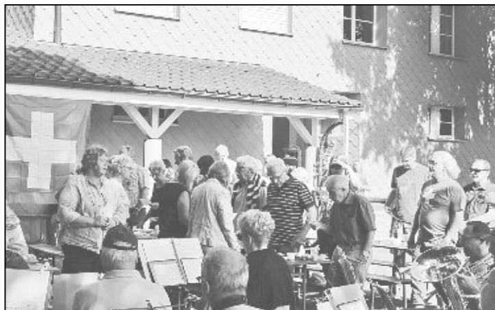
Bei der Nationalhymne gab auch dieses Jahr der Musikverein Feuerthalen den Takt vor. Der Text der Hymne lag griffbereit auf den Tischen.