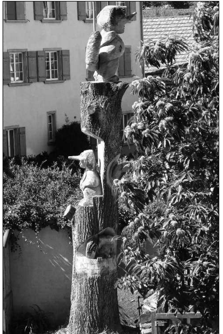
Die aus dem Baumstamm kunstvoll gesägten Trolle schauen frech daher und bewachen Haus und Garten.