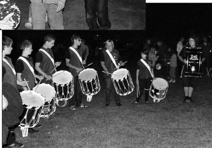
Die Trommlergarde Langwiesen sorgte für den richtigen Takt.

August-Feuer, angereichert mit Vulkanen, Schwärmern und Raketen, liess eine patriotische Stimmung aufkommen. Heil dir Helvetia! Der 1. August ist zum Besinnen, Feiern und Fröhlichsein da.