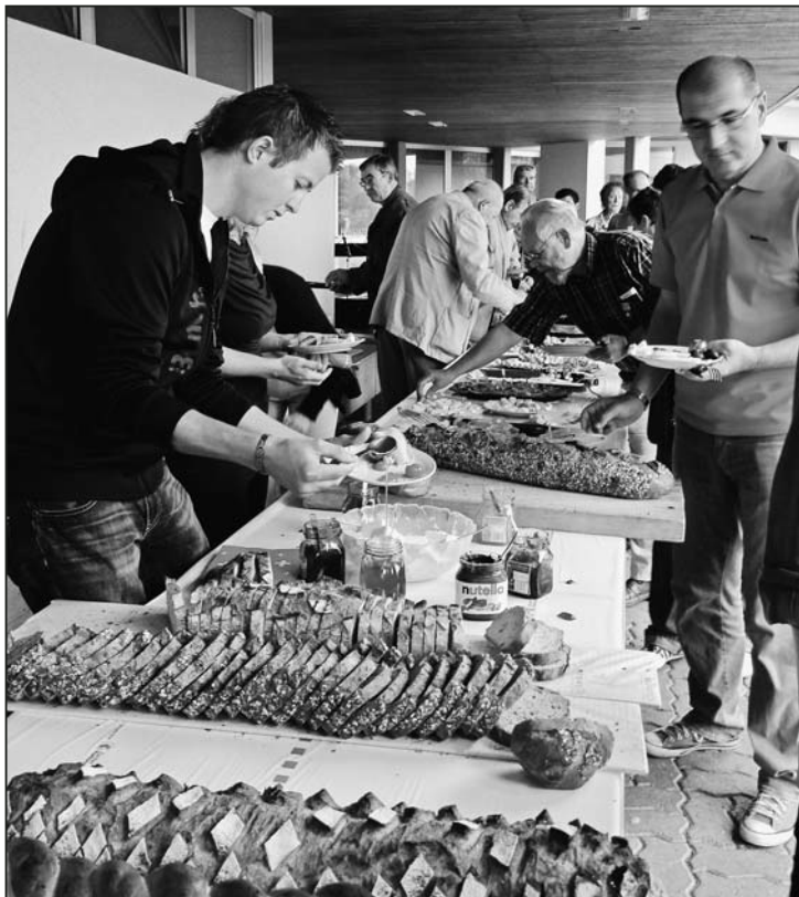
Für jeden Geschmack war gesorgt.

verteilt waren, wurde der Text mehr oder weniger laut mitgesungen.