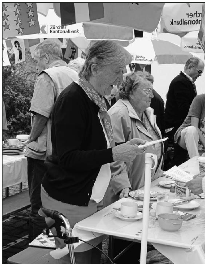
Mit kleiner Unterstützung sass auch der Text der Nationalhymne.

Mit einem kleinen Konzert gab der Musikverein seiner Freude über die vielen Besucher Ausdruck und stimmte schliesslich auch die Nationalhymne an. Stehend und teils hilfesuchend auf die Spickzettel schauend, die auf den Tischen