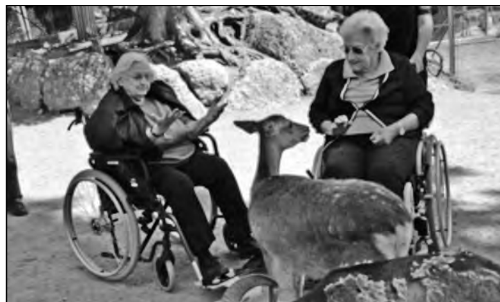
... entspannten Ferien.