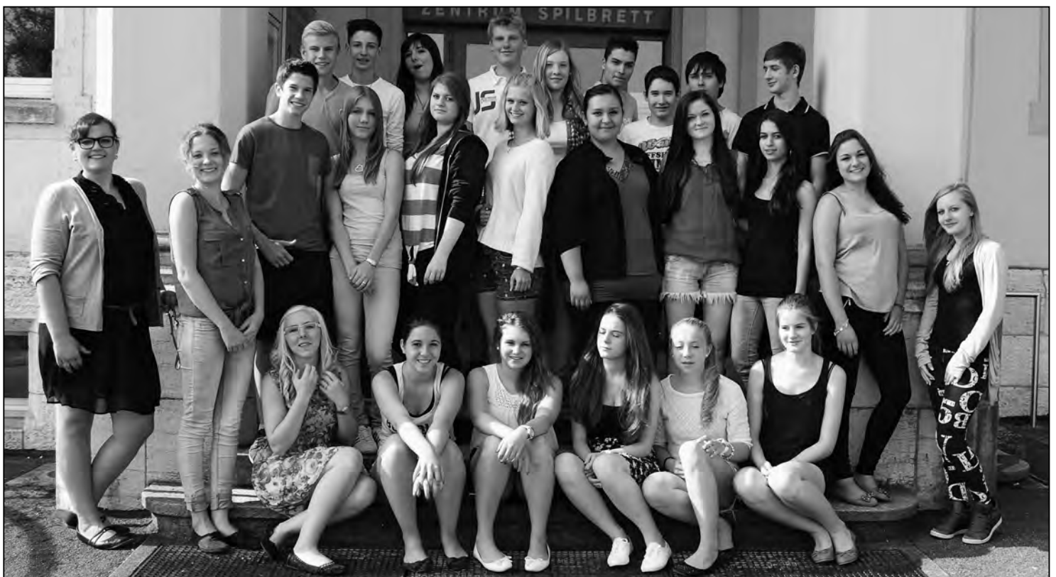
Die Schulabgängerinnen und Schulabgänger 2013 sind bereit für den Einstieg ins Berufsleben.

Die Redaktion des Feuerthaler Anzeigers wünscht allen Schulabgängerinnen und allen Schulabgängern zuerst ein paar schöne Ferientage und dann einen guten Start im Berufsleben!