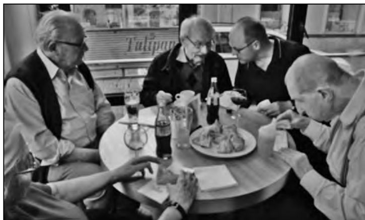
Eindrücke von ...