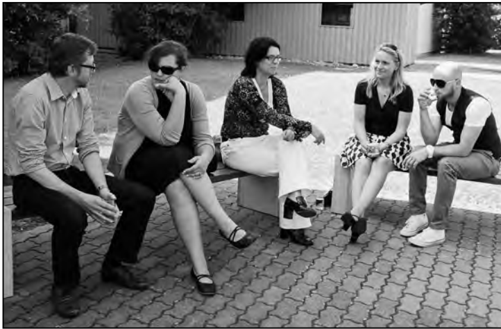
Erfahrungsaustausch im Schatten.