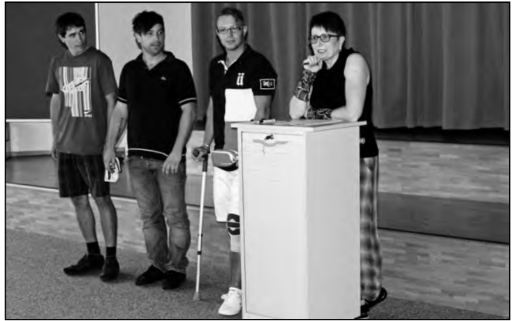
Die Schulpräsidentin stellt die neuen Lehrkräfte vor.