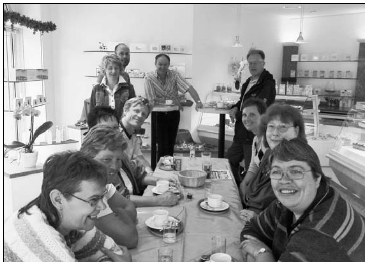
Morgenkaffee im Confiserie-Verkaufsladen.

Koffeingestärkt tippelten wir danach zur Schiffflände, die am Greifensee liegt. Die Ambiance dieser Schiffflände mit der eines kleinen Hafens irgendwo in Italien zu vergleichen ist sicher übertrieben, trotzdem fielen gewisse Parallelen auf: Das Wasser wellte gemütlich vor sich hin, einige Möwen drehten ihre Kreise. Es herrschte eine ruhige, friedliche Stimmung. Am Bootssteg waren viele kleine, farbige Fischerboote befestigt, ein Fischer bereitete sich gerade für eine Ausfahrt vor. Auch auf dem Steg versuchten einige Fischer