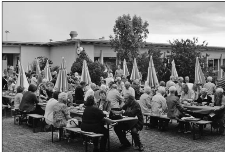
Die Tische sind noch gut gefüllt, trotz der nahenden Gewitterwolken.