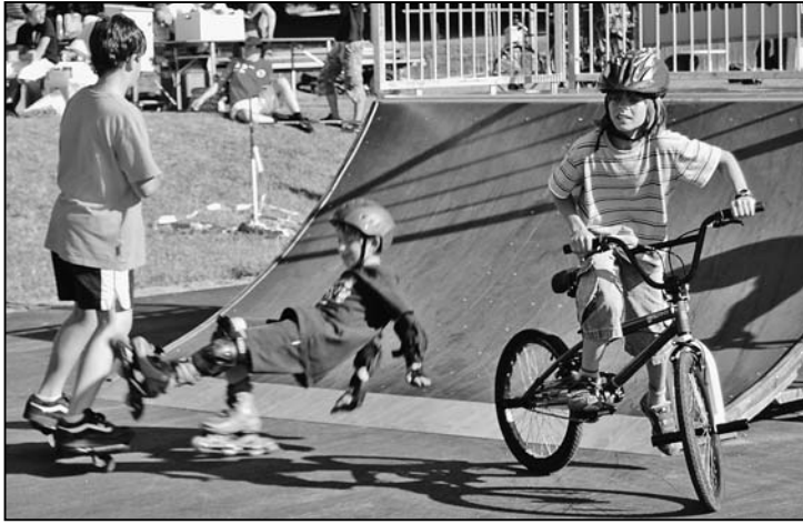
Mit der richtigen Ausrüstung liegt auch mal eine unsanfte Landung drin.