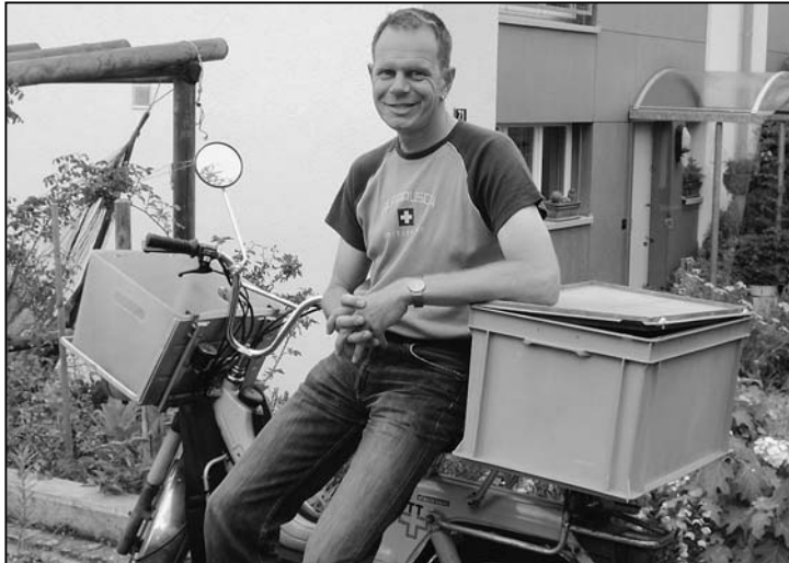
Bald das letzte Mal für die Post unterwegs.

Damals lag der Stelleninhaber schwer krank im Bett. Nach einem Jahr wurde die Stelle dann aber ordnungsgemäss ausgeschrieben. Noch keine Chance für den jungen Fischer, denn sichere Stellen mit regelmässigem Einkommen gingen zuerst an ältere Bewerber. Die nächste Station war wieder Schaffhausen, wo er beim Umladedienst seine in Zürich er-