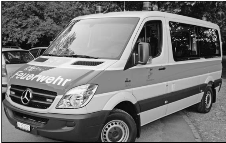
Elegant, sicher und zweckmässig: Mercedes-Benz 315 Sprinter.

Behördenvertreter von Flurlingen und Feuerthalen waren dabei, als die Feuerwehr Ausseramt ihre beiden neuen Personentransporter offiziell in Empfang nehmen konnte.