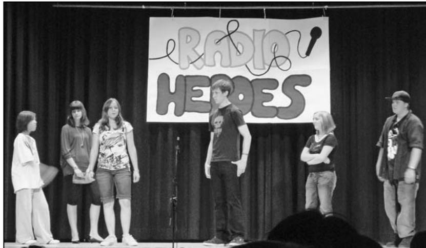
Die «No Tears» und die «Raiders».

Die Story des Stückes entsprach den Jugendlichen: Selina ist in Tim, einen etwas arroganten Moderator vom Radio «Future Smile», verknallt. Yves hingegen ist zur Zeit gar nicht gut zu sprechen auf Tim, weil er