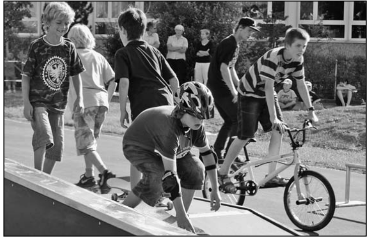
Viel Verkehr am Eröffnungstag.

us. Wissen Sie, was eine Quarterpipe ist? Können Sie sich etwas unter einer Beryl Bank oder einer Pandora Box vorstellen? Sagt Ihnen wenigstens der Ausdruck Railslide etwas? Falls Sie all diese Fragen mit «nein» beantworten müssen, stehen bei Ihnen zu Hause wahrscheinlich weder Skateboard, BMX-Velo noch Inline-Rollschuhe im Keller und Sie waren auch nicht an der Eröffnung des Feuerthaler Streetparkes.