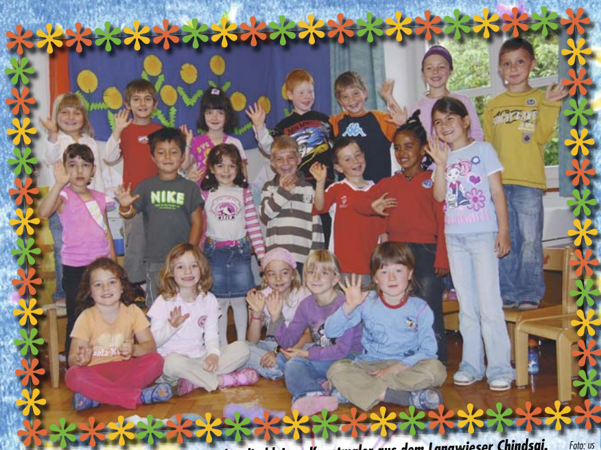
Die Arbeit hat ihnen Spass gemacht: die kleinen Kunstmaler aus dem Langwieser Chindsgi.