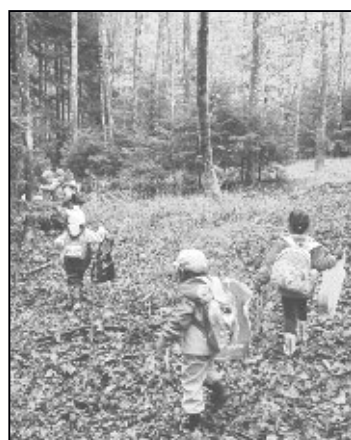
Abfallsammeln im Wald.

Supermarkt retourbringen. Ein grosser Gewinn für unsere Umwelt und unseren Abfallmarkengeldbeutel. Sogar Hartplastik mit dem eingepprägten Dreieckzeichen kann man in einem speziellen Sack sammeln und im Werkhof abgeben. Das sind zum Beispiel Joghurtbecher, Plastikschalen von Früchten und Gemüse, Quarkbecher, Fleischverpackungen, ... übrig geblieben sind am Schluss nur ein kleines Häufchen Plastikfolien und Orangennetzchen, die den Weg in den Schwarzabfall gefunden haben. Absolut befriedigend, trotz dem vielen Abfall, den wir täglich produzieren, vieles davon wieder recyceln zu können.