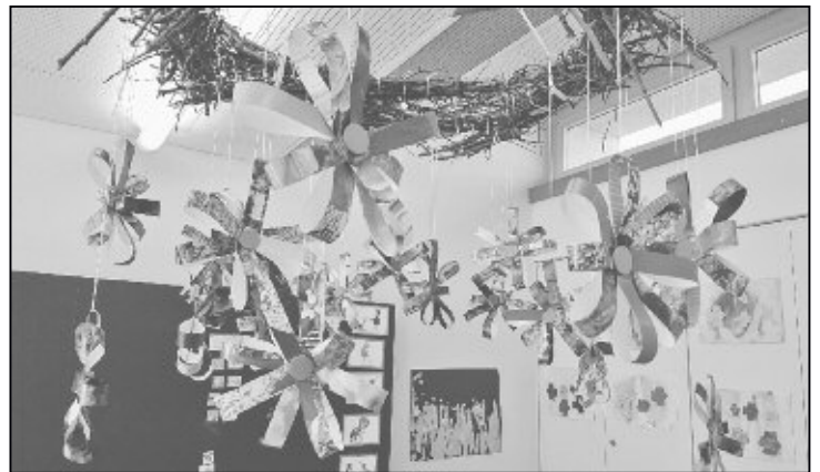
Basteln mit Abfallmaterial.

ma gab es in allen Kindergärten eine Lektion, welche die Kinder ans Thema heranzuführte. Ein Zauberer wollte sein Schloss aufräumen. Als beste Lösung kam ihm in den Sinn, den angesammelten Abfall aus dem grossen Eingangstor zu werfen. Da hat sich der Abfall dann zu einem Berg angesammelt. Als der Zauberer nach der Arbeit in seinem Schlossgarten ausruhen möchte, wundert er sich über den Abfall in seinem Garten. Wer hat ihn nur da hingeworfen? Er entscheidet sich einmal eine Nacht darüber zu schlafen. Doch am anderen Morgen sieht sein Garten immer noch gleich verdreckt aus. Da kommt ihm in den Sinn, dass er ja Zauberkräfte hat. Er zaubert einen kräftigen Wind. Aber selbst mit den Kindergartenkindern, die ihm mit kräftigem Blasen helfen, erreicht er nichts. Zum Glück sitzen kluge Kinder im Kreis. Schnell ist der Rat da, die Sachen zu entsorgen. Der Zauberer bringt einen Abfallsack und einen Kompostsack und beginnt die Säcke mit dem Abfall zu füllen. Aber Halt, das Altpapier kommt doch nicht in den Schwarzabfall! Die Kinder helfen dem Zauberer alles richtig zu entsorgen. Glas, Karton, Batterien, CD's, Büchsen, Alufolien, Korkzapfen, Bierverschlüsse, Kaffeekapseln, Glühbirnen, Papier, Altkleider, Petflaschen, diverse Plastikflaschen und der Kompost gehören ALLE NICHT in den Schwarzabfall. Wie praktisch ist es, das wir alles gratis entsorgen können. Das Altpapier wird sogar vor unserem Haus abgeholt! Oder man kann vieles einfach in den