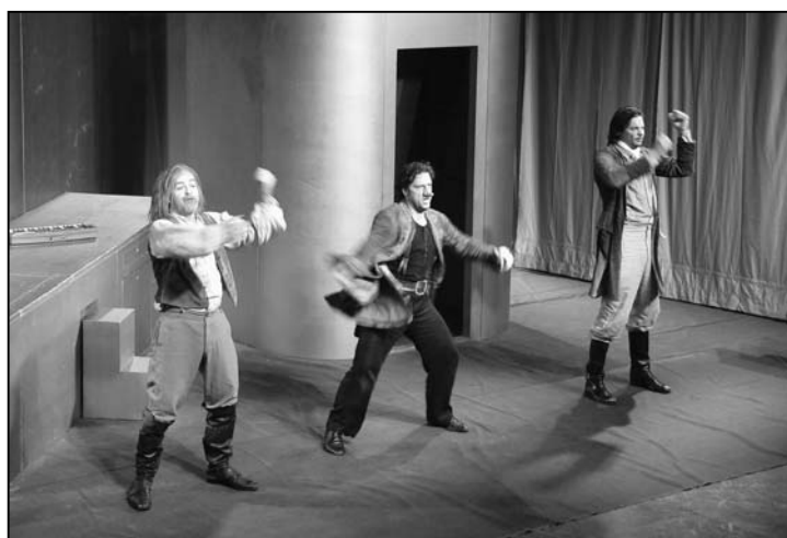
Action auf der Bühne.

Komische Grimassen, Hip-hop-Einlagen und witzige Dialoge machten das Freilichtstück «Cyrano» zu einer gelungenen Aufführung. Nach einem unter-