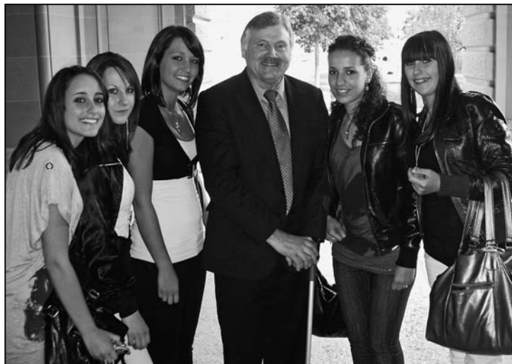
Auch SVP-Politiker Hans Fehr lässt sich für ein Foto gerne charmant umrahmen.

Eine eindruckliche Schulreise durfte die Sek C erleben. Nachfolgend ein paar Ausschnitte aus Berichten, welche die Schülerinnen und Schüler zusammengetragen haben.