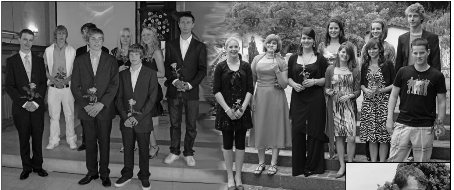
Konfirmandinnen und Konfirmanden stehen im Mittelpunkt.

Damit die Konfirmation aus Platzgründen nicht in der Turnhalle Stumpfenboden abgehalten werden musste, fanden gleich zwei Konfirmationssonntage in der Kirche statt.