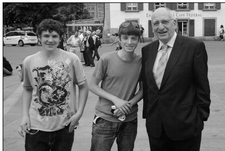
Unser viel kritisiertes Gesundheitsminister Pascal Couchepin ist doch eigentlich ganz nett.