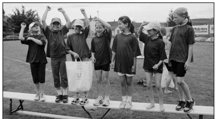
Die Siegerinnen der Pendelstafette.