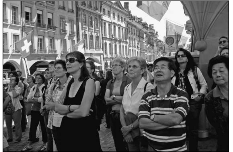
«Heute sind wir auch Touristen...»

gloggeturm und warteten auf das berühmte Glockenspiel. Nach dem Mittagessen stand der eigentliche Höhepunkt des Ausfluges auf dem Programm, der Besuch des Bundeshauses. Das Herumhüpfen zwischen den hochschiessenden Wasserfontänen auf dem Bundesplatz überliessen wir gerne den zahlreichen Kindern. Wir freuten uns viel mehr darauf, einmal einen Blick ins Innere unseres Parlamentsgebäudes, welches übrigens 1902 nach Plänen des Architekten H. Auer gebaut wurde, zu werfen. Die Sicherheitskontrollen waren genauso streng wie diejenigen am Flughafen. Die anschliessende Führung erwies sich schliesslich als äusserst interessant. Beeindruckend war die zentrale Kuppelhalle zwischen den beiden Ratssälen mit ihren zahlreichen Darstellungen zur Schweizer Geschichte. Beim Blick auf die drei Eidgenossen beim Rütlichschwur fragten sich manche, wie die drei denn nun wohl schon wieder geheissen haben. Den meisten kam auf Antrieb eigentlich nur der Stauffacher in den Sinn... Einen Hauch von der grossen Politik in unserem Land bekamen wir schliesslich im Ständerats- und National-