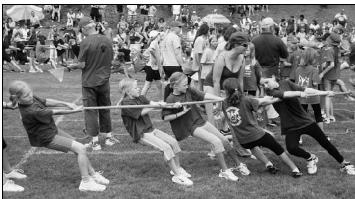
Feuerthalerinnen beim Tauziehen.

Allen bereitwilligen Helferinnen sei an dieser Stelle herzlich gedankt.