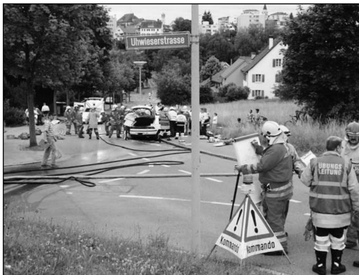
Übersicht über den Schadenplatz.

Zuerst wurden die Velofahrer und die verletzte Augenzeugin fachgerecht verarztet und betreut, während beim Unfallauto das weitere Vorgehen besprochen und eingeleitet werden musste. Auch wurde der Verkehr weiträumig umgeleitet. Über die Notrufnummer 144 waren inzwischen auch Feuerwehr und Rettungsdienst alarmiert worden, die denn