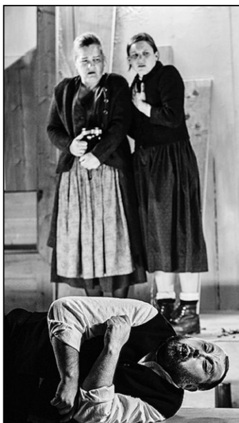
Gar schauerliches spielte sich einst im Emmental ab.

Die schaurige Geschichte der mutigen Christine, die in höchster Not einen Pakt mit dem Teufel eingeht und dabei hofft, diesen schlussendlich überlisten zu können, spielt vor vielen