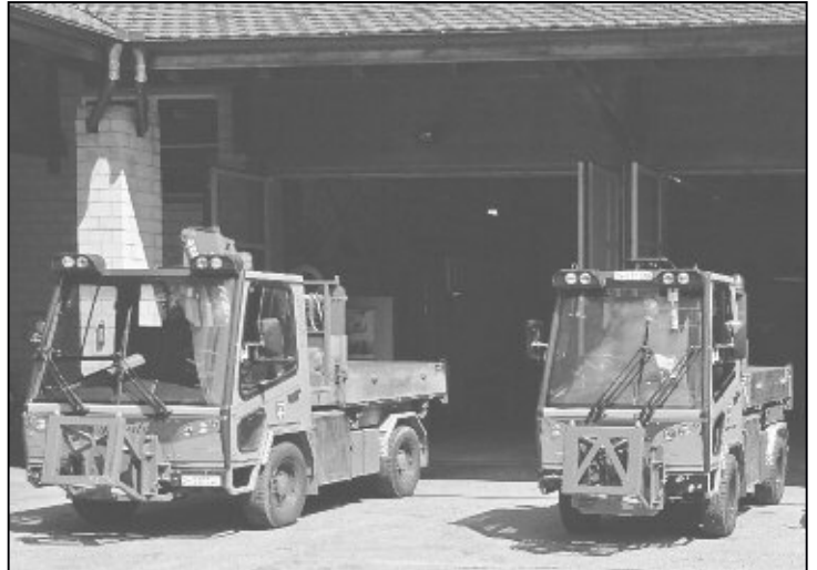
Grosser Meili VM 3500 und Kleiner Meili VM 1300.

Modell den Aebi KT 80 ersetzen soll. Das Modell Meili VM 1300 mit einer kürzeren Spur aber sonst fast identisch mit dem bereits vorhandenen Fahrzeug derselben Marke, welches bereits bei uns im Einsatz ist, hat sich dann aber durchgesetzt und der Gemeinderat hat für die Beschaffung dieses neuen