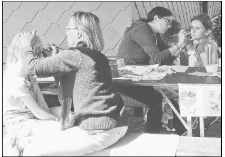
Wer wird die Schönste am «Fäscht für alli»?

«Marchstei Betreutes Wohnen AG», die Institution für Men-