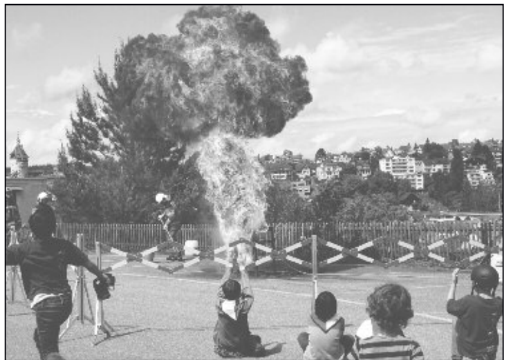
Die Feuerwehr zeigt, warum man einen Öl-Brand in der Küche niemals mit Wasser löschen soll – eindrücklich!