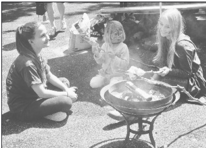
Während die Eltern das Dessertbuffet geniessen, bräteln sich die Kinder lieber ihr Schlangebrot.