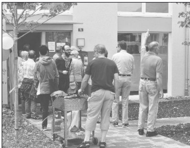
Kommen und Gehen im neuen «Haus 3» der WG Marchstei.