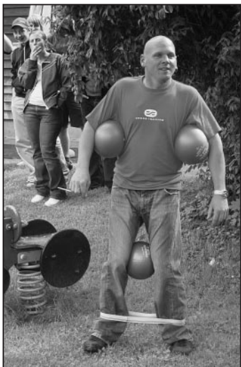
Sieht das nicht geil aus?

Die rund 50 Gäste des Hilarivereins Feuerthalen haben es sicher nicht bereut, sich diesen Tag im Kalender eingetragen zu haben.