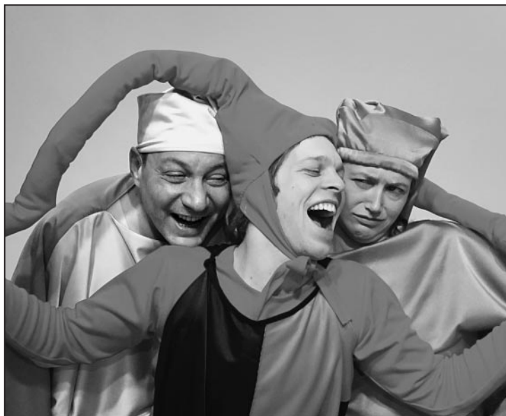
Till Eulenspiegel – der witzige aber rotzfreche Bengel.

Die Vorstellung findet am Freitag, dem 17. Juni, um 20.30 Uhr auf dem Schulhausplatz Stumpenboden an der Erlenstrasse in Feuerthalen statt. Bei schlechter Witterung in der Mehrzweckhalle Stumpenboden. Der Eintritt ist frei. Interessierte Kinder haben nur Zutritt, wenn sie sich das ganze Stück ansehen wollen, neben ihren Eltern sitzen bleiben und von diesen beaufsichtigt werden. Veranstalter ist die Kulturkommission Feuerthalen unter dem Patronat der Politischen Gemeinde Feuerthalen.