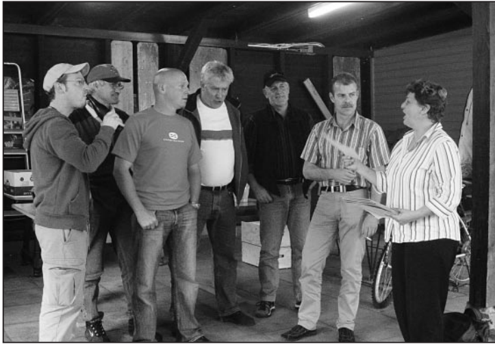
Gespanntes Warten auf den Preis.

Ein Event jagt den anderen. Nach dem Hilari und der Generalversammlung, stand nun das berühmte Helferessen des Hilarivereins Feuerthalen auf dem Programm.