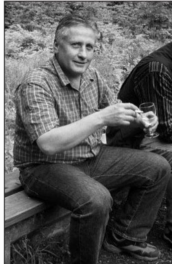
Ein Gläschen in Ehren kann man dem Koch nicht verwehren.