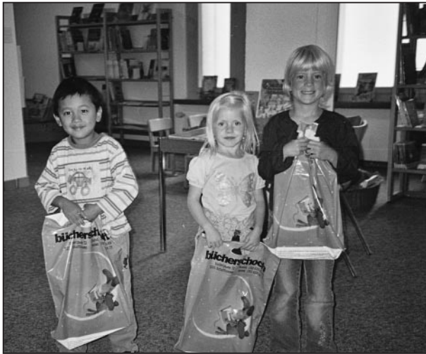
Mit dem Kindergarten zum ersten Mal in der Bibliothek.