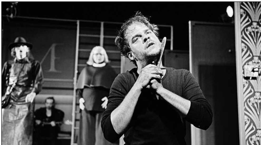
«Romeo und Julia»: Welttheater ohne Happyend!

Auf einem Fest begegnen sie sich zum ersten Mal, ein Blick genügt, um eine stürmische Leidenschaft zu entfachen. Nur heimlich, im Schutz der Nacht, kann Romeo zu Julias Balkon gelangen. Dort versprechen sie sich ewige Treue.