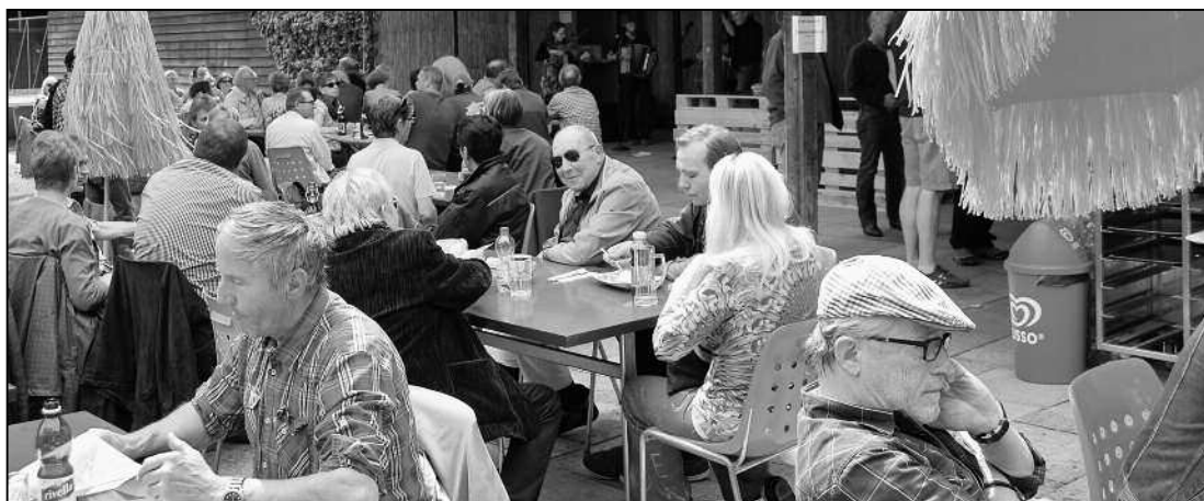
«Full Garden» in der Rheinwiese.