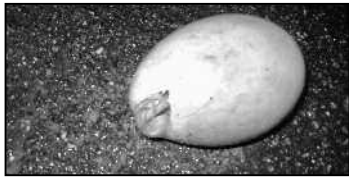
Auf diesem Foto ist gut zu sehen, dass im zerstörten Ei bereits ein Fötus entstanden war.