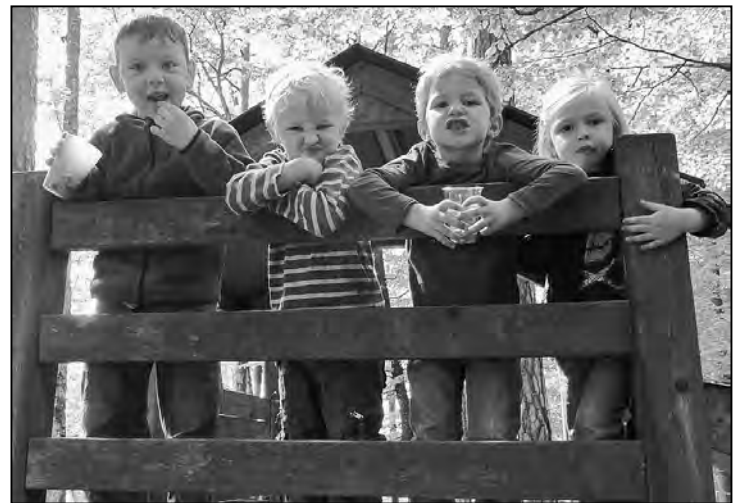
Auf dem Kletterturm.