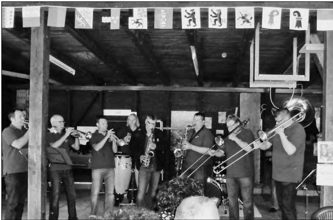
Hoffentlich nicht zum letzten Mal: Die Hilarimusik auf der Rhywiese.

steht noch in den Sternen, denn bekanntlich ist es noch nicht geklärt, wie es mit der Rhywiese weitergeht. Es bleibt zu hoffen, dass die massgebenden Leute dies- und jenseits des Rheins eine gute Lösung finden werden.