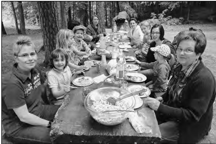
Einer der beiden von uns belagerten Tische.

Eine Schar Kinder belagern das Uhwieser Hörnli.