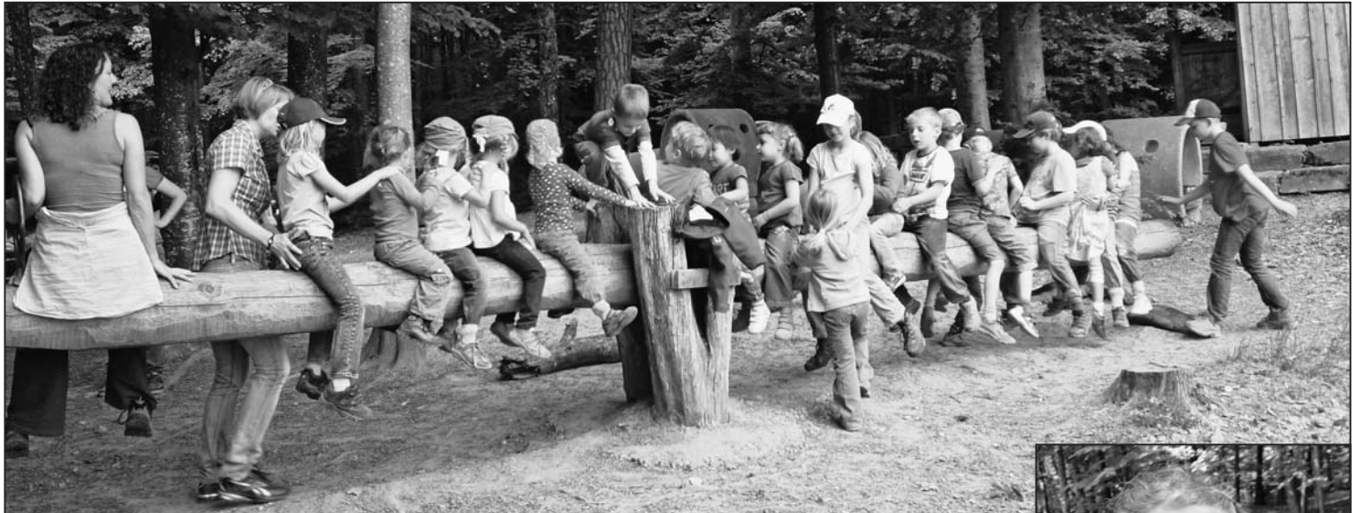
Welche Seite ist schwerer?

Eine grosse, lustige Schar war wieder einmal unterwegs aufs Uhwieser Hörnli.