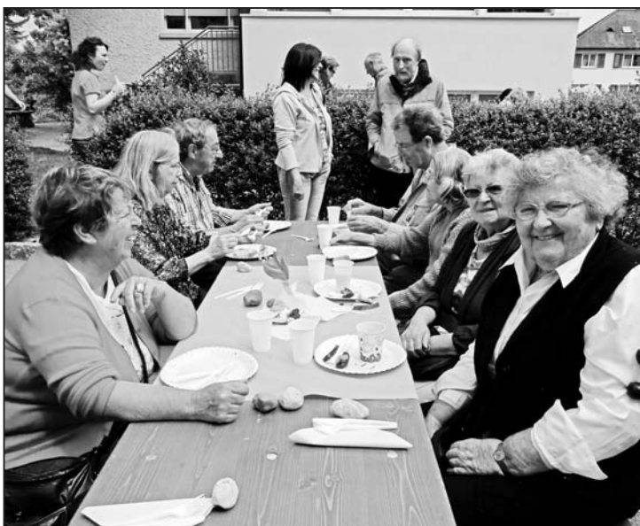
Die Gäste geniessen sowohl das Wetter als auch das kulinarische Angebot.

de, neigte sich bald dem Ende zu. Betreuer und Bewohner können stolz auf einen gelungenen Tag der offenen Türen zurückschauen.