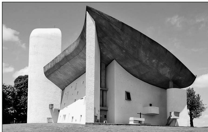
Chapelle Notre Dame du Haut in Ronchamp.

Für zusätzliche Auskünfte wenden Sie sich bitte an unser Sekretariat. Ihre Anmeldung richten Sie bitte bis spätestens