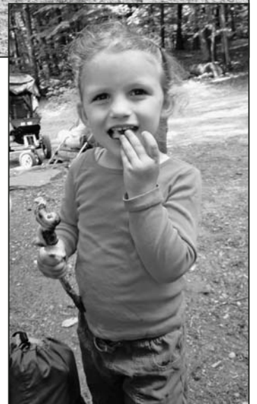
Mmh... Schlangebrot isch fein.

Das Muki-Turnen beginnt gleich nach den Sommerferien und dauert bis zu den Frühlingsferien 2012. Wir turnen jeweils am Freitagmorgen von 9.00 bis 10.00 Uhr oder von 10.00 bis 11.00 Uhr. Wer Inte-