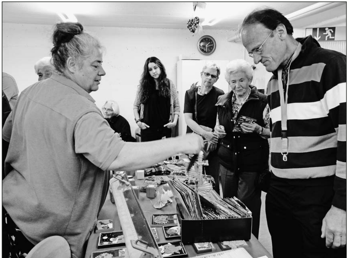
Wie auf jedem Bazar wird auch hier tatkräftig gehandelt.