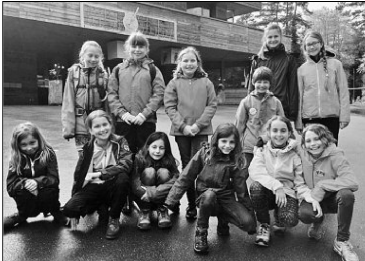
Sie hatte richtig Spass, die «Domino»-Gruppe.

Während diesen Tagen begleitete uns das Thema der «Schöpfung» – mit verschiedenen passenden Geschichten, kreativen Werken, singen, spielen und erleben in der Natur soweit das Aprilwetter dies zulies! Beim Besuch im nahegelegenen Naturzentrum Thurauen konnten wir viel neues Wissen erwerben, das dann am Abend gleich beim Casino-Spiel eingesetzt werden durfte. Ist Ihnen bekannt, woher der Eisvogel seinen Namen hat, wie eine Posthornschncke aussieht, was ein Prallhang ist, wel-