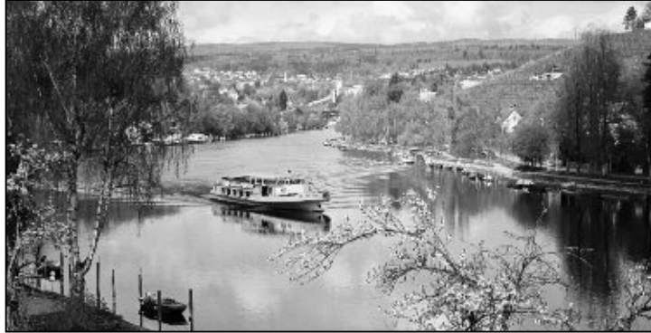
Der Faktor «Lage» spielt eine wichtige Rolle bei der Wahl einer Wohnimmobilie.

Beim Kauf von Wohneigentum wird dem Faktor «Lage» gerne und zu recht eine hohe Priorität eingeräumt, denn bekanntlich lässt sich bei einer Immobilie alles ändern, nur die Lage nicht. Jede Käuferschaft beurteilt die Attraktivität der Lage einer bestimmten Wohnung oder eines Gebäudes nach individuellen Kriterien (z.B. soziales Umfeld, Arbeitsweg, Besonnung, Privatsphäre, Aussicht, Kindergarten, Sport, Erreichbarkeit, ÖV) und bewertet diese unterschiedlich. Dennoch gibt es einige Lageattribute, welche die meisten Interessenten als wertvoll erachten und die deshalb oft zur Bedingung für einen Kauf gemacht werden. Zu den Lagequalitäten, die Einfluss auf einen höheren Kaufpreis haben, zählen insbe-