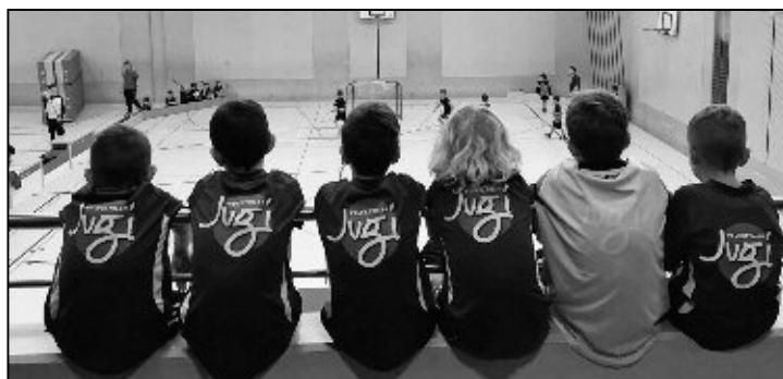
Ob hier schon der nächste Gegner studiert wird?