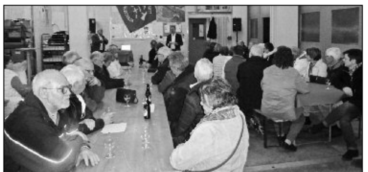
Vortrag und Apéro im Feuerwehrmagazin.