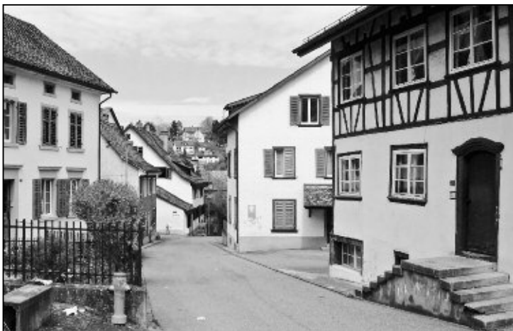
Die Adlegasse, einst die «Einkaufsmeile» von Feuerthalen.