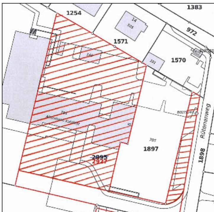
Grundstücke Kat.-Nr. 1897 (SanHist) und Kat.-Nr. 2927

Für die Realisierung einer Überbauung, welche sich besonders gut in die bestehende bauliche und landschaftliche Umgebung integrieren soll, entschied der Gemeinderat im Rahmen eines Konkurrenzverfahrens einen Investor zu suchen, welchem die beiden Grundstücke verkauft werden sollen. Mittels eines Investorenwettbewerbs wollte sich der Gemeinderat zudem möglichst lange den Einfluss auf das zu überbauende Grundstück erhalten, damit die Interessen der Gemeinde optimal eingebracht werden können. Um einen offenen und transparenten Prozess gewährleisten zu können, entschied er sich für die Durchführung eines zweistufigen, selektiven Planungswettbewerbs für Investoren und Planer: In der ersten Stufe wurden sechs Teams bestehend aus einem Investor sowie einem Planer für die Teilnahme am Planungswettbewerb selektioniert (Präqualifikation). Die zweite Stufe bestand aus der Abgabe eines verbindlichen