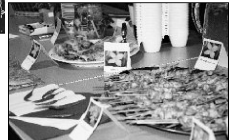
Feine Spezialitäten aus dem Surinam.