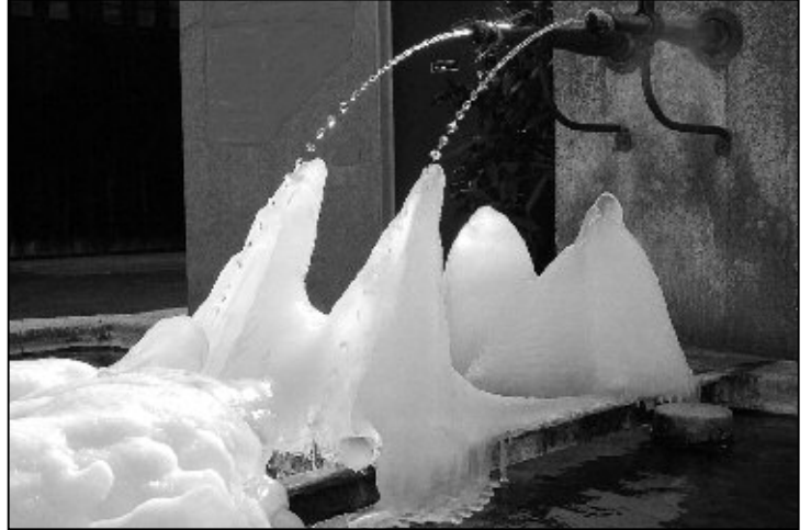
Der Brunnen trägt die Jahreszahl 1853. Wie viele Eisgebilde hat es in 165 Jahren seither schon gegeben?

sprechend baute er ein Gebilde, wie Stalagmiten entsprechenden Eishörnern auf. Durch das Gegenlicht der Sonne wirkten die im Bogen fallenden Wasserstrahlen wie Glasperlen. Selbst die senkrecht von den Brunnenrohren fallenden Tropfen ergaben noch zwei zusätzliche Kegelgebilde. Das Eisgebilde ist natürlich vergänglich, denn schon am nächsten Tag, bedingt durch ansteigende Temperatur und Schneefall, begann sich das Kunstwerk leider wieder zurück zu bilden.