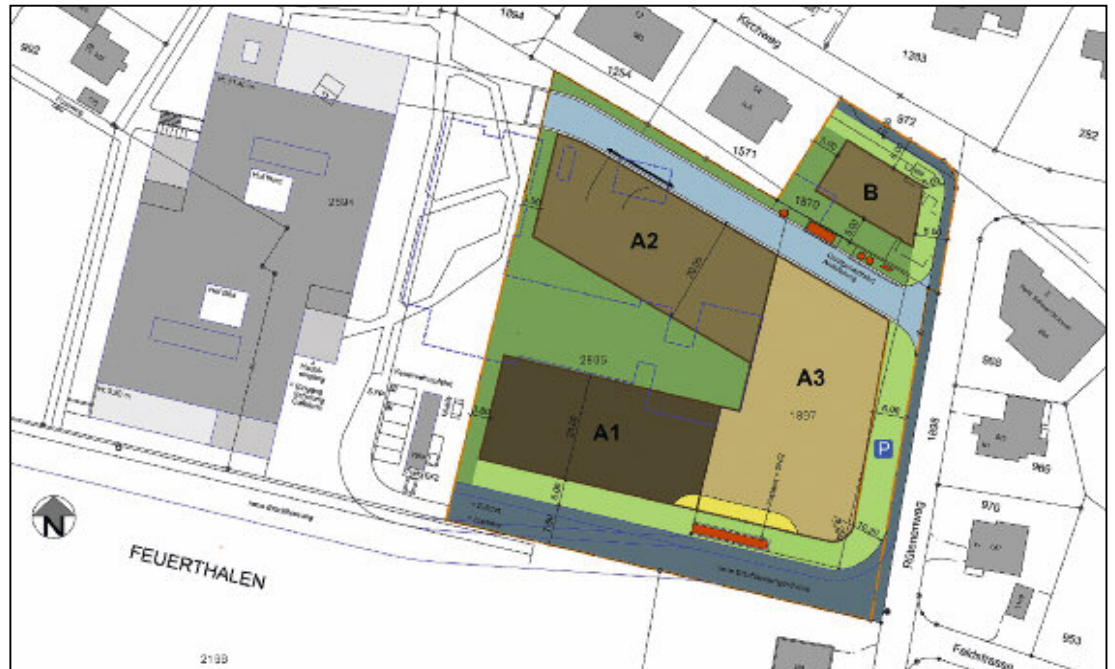
Gestaltungsplan Alters- und Familienwohnungen Kohlfirst mit drei Baufeldern A1, A2 und A3.

Im Gebiet Kohlfirst befand sich bis 2016 das im Jahr 1972 erbaute, gleichnamige Alters- und Krankenhaus des Zweckverbands «Zentrum Kohlfirst», welcher aus der Gemeinde Feuerthalen und den drei umliegenden Gemeinden Flurlingen, Dachsen sowie Laufen-Uhwiesen besteht. Das Alters- und Krankenhaus entsprach nicht mehr den heutigen Bedürfnissen und Zielsetzungen des Zweckverbandes. Aus diesem Grund führte der Zweckverband 2011 einen Projektwettbewerb durch. Das siegreiche Projekt wurde zwischen Juni 2014 und August 2016 auf einem Nachbargrundstück realisiert. Der Bezug des neuen Zentrums Kohlfirst erfolgte im August 2016. Der Altbestand wurde im Winter 2016/2017 durch den Zweckverband vollständig zurückgebaut. Die dadurch frei werdenden Grundstücke, Kat.-Nr. 1897 (Sanitätsstützstelle; Fläche: 1 568 m 2 ) und Kat.-Nr. 2927 (vormals Kat.-Nr. 2895; Fläche: 3 725 m 2 ) gingen nach dem grundbuchamtlichen Vollzug eines im Jahr 2013 vertraglich vereinbarten Landabtauschs mit dem Zweckverband «Zentrum Kohlfirst» im De-