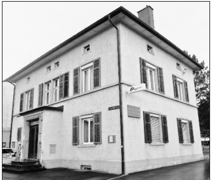
Das Geburtshaus Sutermeisters an der Schützenstrasse 2 beherbergt heute unter anderem das Ortsmuseum und den Polizeiposten.