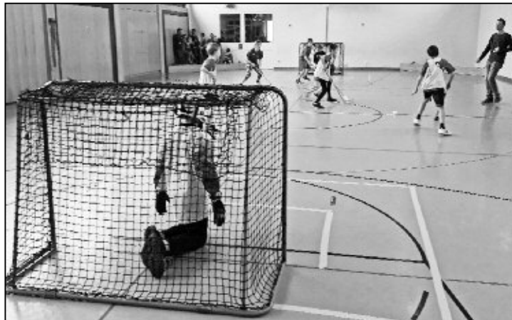
Hier gehts zur Sache ...

In dieser Saison nun sind wir mit drei Teams unterwegs: Feuerlöwen (Jugend, Jg. 2004 / 2005), Feuerpandas (Schüler,