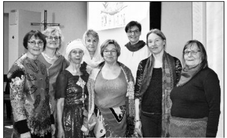
Elegant, in südamerikanischem Stil gekleidete Frauen aus Feuerthalen.

Surinam ist es möglich, dass verschiedene Kulturen und Ethnien friedlich zusammenleben und die unberührte Natur ist der Lebensraum einer reichen Fauna und Flora. Doch die Frauen erklärten, wie in Surinam der Wirtschaftszusammenbruch droht, da das Land vom Export ihrer Ressourcen abhängig ist und diese durch die Umweltverschmutzung zerstört wird. Durch die Gier nach Gold werden die Flüsse und Seen von Quecksilber vergiftet. Die Lunge der Erde, der Regenwald, wird durch radikale Abholzung platt gewalzt und die Küsten Surinams werden mit dem Anstieg des Meeresspiegels überschwemmt. Der Lebensraum für Menschen und Tiere in Surinam, aber auch über die ganze Welt hinweg gesehen, befinden sich durch den übermässigen Konsum und den unachtsamen Umgang mit der Erde in Gefahr. Mit dem Leitsatz «Informiert beten – betend handeln» forderten die Frauen des Weltgebetstages die Menschen auf,