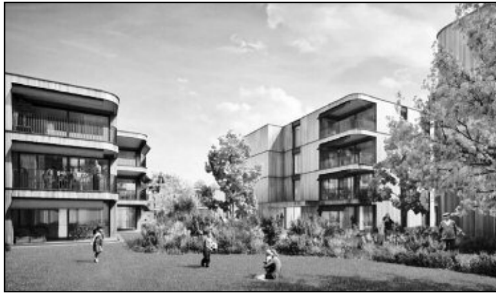
Visualisierung Richtprojekt «Quintett».

Verkaufsverhandlungen zwischen dem Gemeinderat Feuerthalen und Vertretern des Investors, Fortimo Invest AG, führten zum Ergebnis, dass die Grundstücke Kat.-Nr. 2927 und Kat.-Nr. 1897 zum Preis von CHF 945.00/m 2 und damit