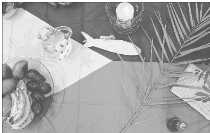
Einen vertieften Einblick in das Leben und die Lebenssituation auf den Philippinen bot der Weltgebetstag im Zentrum Spilbrett.

Nach einem kurzen Vortrag des Vorbereitungsteams, der mithilfe schöner Fotografien einen ersten Überblick über die