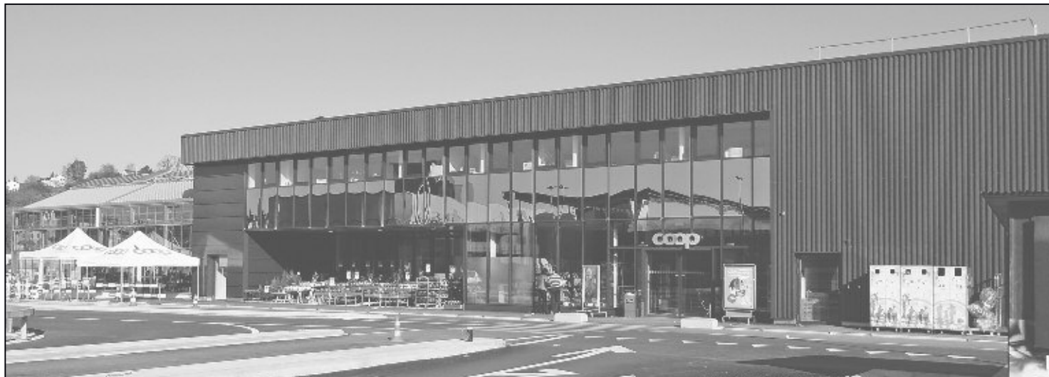
Coop-Neubau: Im modernen und gefälligen Neubau kann nun eingekauft werden – wenn auch vorerst im Provisorium.

Ein grosser Teil des neuen Rhymarktes in Feuerthalen ist fertiggestellt. Im Erweiterungsbau wurde letzte Woche ein «provisorisches Einkaufszentrum» eröffnet.