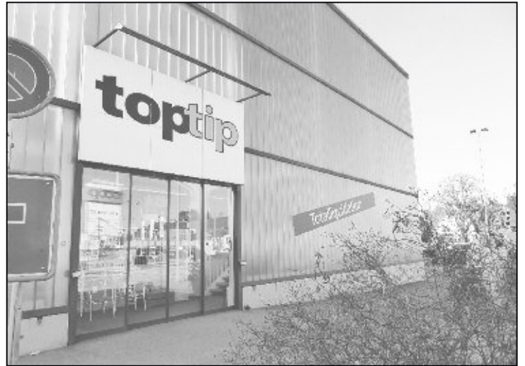
«Totalliquidation»: Die Feuerthaler Toptip-Filiale wird geschlossen.

dem Feuerthaler Anzeiger. Das neue Ladenkonzept von Toptip erfordere grössere Ladenflächen, erklärt sie, diese stünden in Feuerthalen nicht zur Verfügung. Die betroffenen Mitarbeitenden seien ab Ende Januar informiert worden sagt die