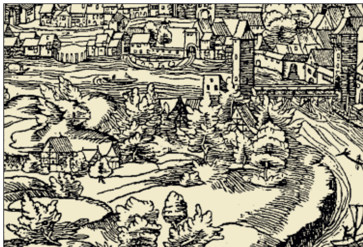
Ein Holzschnitt von 1586 zeigt Feuerthalen mit einem einzigen Gehöft.

Auf diese Weise erhält Feuerthalen eine neue Ortsgeschichte – online und im Ortsbild für alle sichtbar. Wichtig dabei ist dem Gemeinderat,