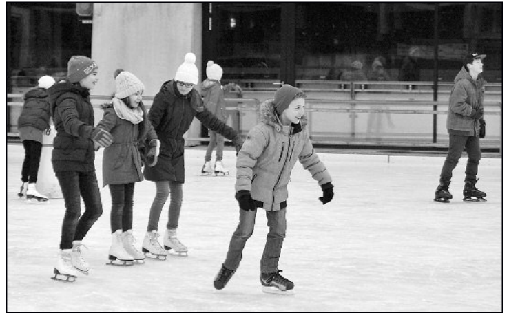
Eislaufen macht Spass!