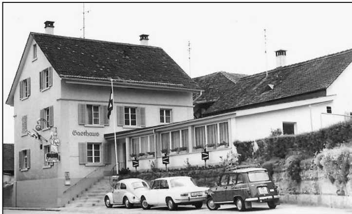
Das «Bahnhöfli» im Jahr 1967. Das Bild stellte Kurt Meier aus Langwiesen zur Verfügung. Es wurde von seiner Mutter gemacht, welche früher in Langwiesen fleissig Besonderes für die Nachwelt ablichtete.

Jahres geplant, wodurch die Immissionen dieser Bauprojekte minimiert werden. Wir möchten ein gefälliges Gebäude realisieren, das sich gut ins Langwieser Dorfbild einfindet.»