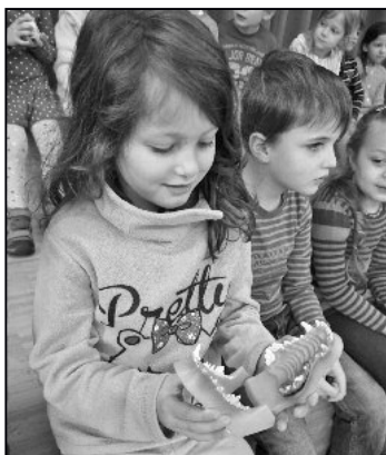
Wow...sieht aber «gfüchtig» aus, so ein Hundgebiss.