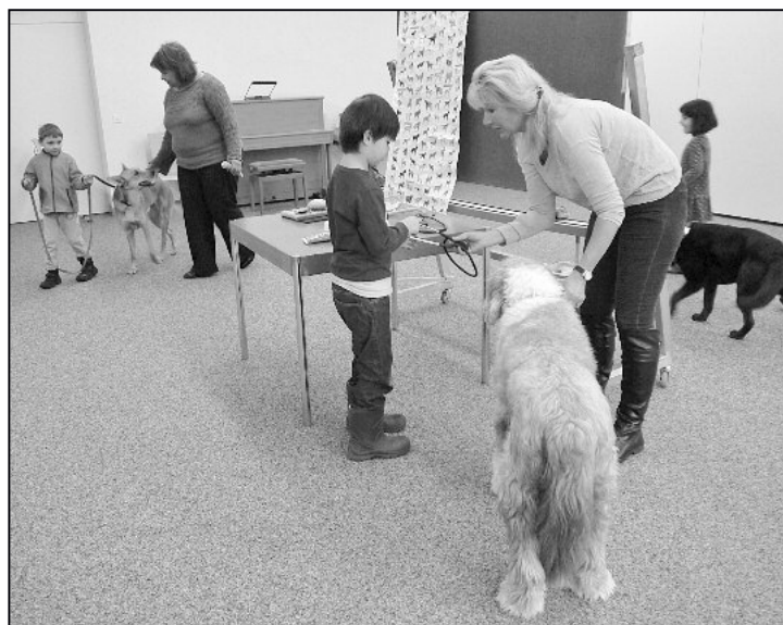
Vor dem Hund muss man keine Angst haben – wenn man es richtig macht.

An der diesjährigen Hundeschulung vom Kindergarten ler-