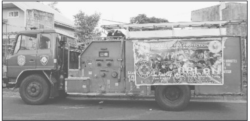
Ob Feuerwrautos oder Brandschutzkleidung, von allem hat es zu wenig und alles ist in einem desolaten Zustand.