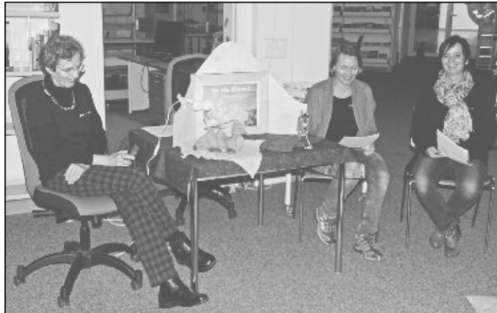
Die Vorlesung der Adventsgeschichte wurde von über 40 Kindern und deren Eltern besucht.

Das Highlight im vergangenen Jahr war ein Leseförderungsprojekt, das sich an die Kinder, vom Kindergarten bis zur 6. Klasse, richtete. Acht Weinländer Bibliotheken führten zusammen einen sogenannten Lesefrühling durch. Unter dem Motto, «Lesen bringt dich weiter», wollten wir zusammen den «Rhein hinunter lesen». Jedes Kind bekam einen Lesepass, worin es seine gelesenen Seiten eintrug. Mit jeder gelesenen Seite fuhren wir einen Me-