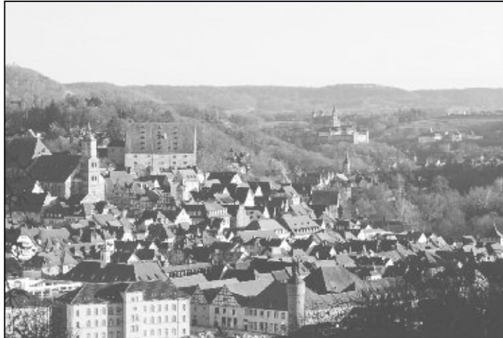
Blick auf die wunderschöne Altstadt von Schwäbisch Hall.

Das wunderschöne Städtchen Schwäbisch Hall vermag seine Besucher bereits seit Jahrzehnten zu begeistern: Die unverwechselbare Stadtsilhouette – ein mächtiges Fachwerkensemble, das sich vom Kocher her den Hang hinaufzieht, wäre allein schon Grund genug, Schwäbisch Hall entdecken zu wollen. Die ganz besondere Atmosphäre der alten, von den