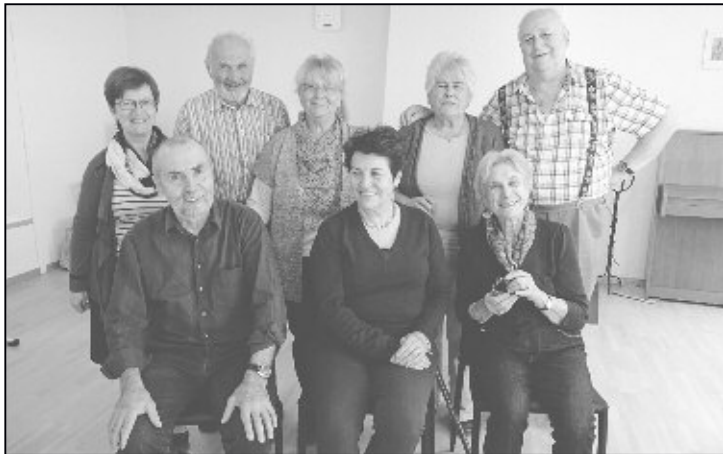
Das Ensemble des Seniorentheaters der Pro Senectute Kanton Schaffhausen.

Kanton Zürich ORTSVERTRETUNG FEUERTHALEN- LANGWIESEN