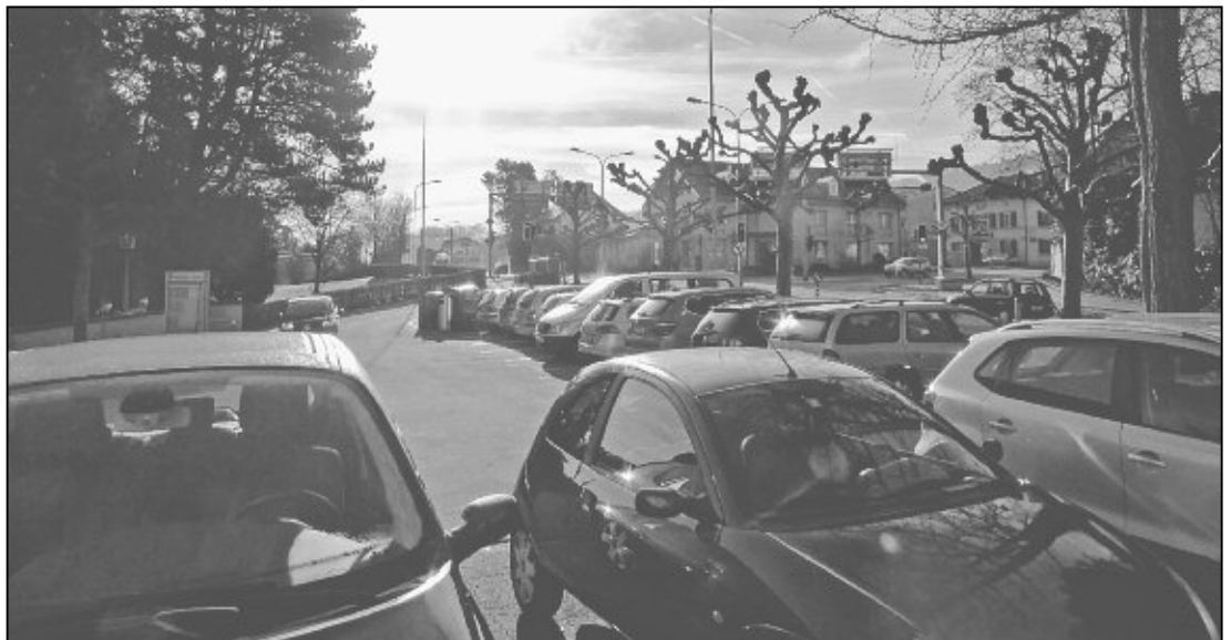
Gemeindehaus-Parkplatz an einem Donnerstagvormittag: Keine Chance für Gemeindehausbesucher ein freies Parkfeld zu finden.