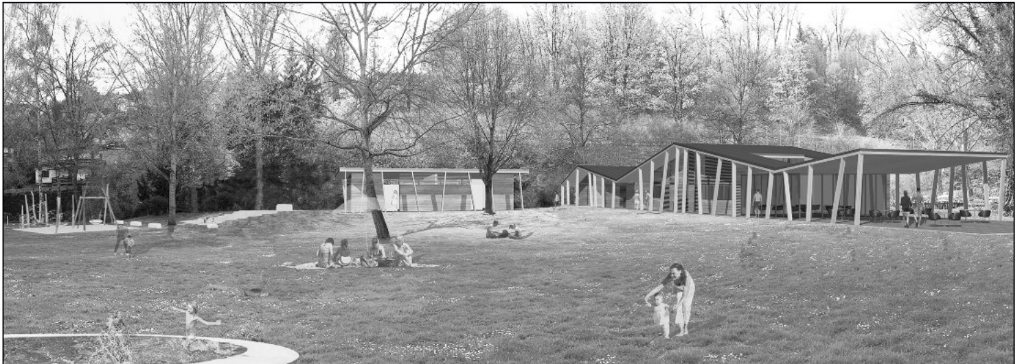
Freizeitanlage Rheinwiese im Mai 2018.

Die Feuerthaler und Langwieser Stimmbürger haben entschieden: 63 Prozent sagten JA zur Vorlage des Gemeinderates für die Totalsanierung der Freizeitanlage Rheinwiese. Genauso erfreulich wie dieses Resultat dürfte für den Gemeinderat an diesem Abstimmungswochenende die hohe Stimmbeteiligung von 68,37 Prozent gewesen sein.