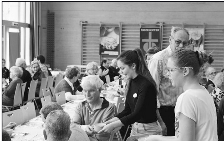
Die diesjährigen Konfirmanden verteilen die Suppe an die Gäste des ökumenischen Gottesdienstes.