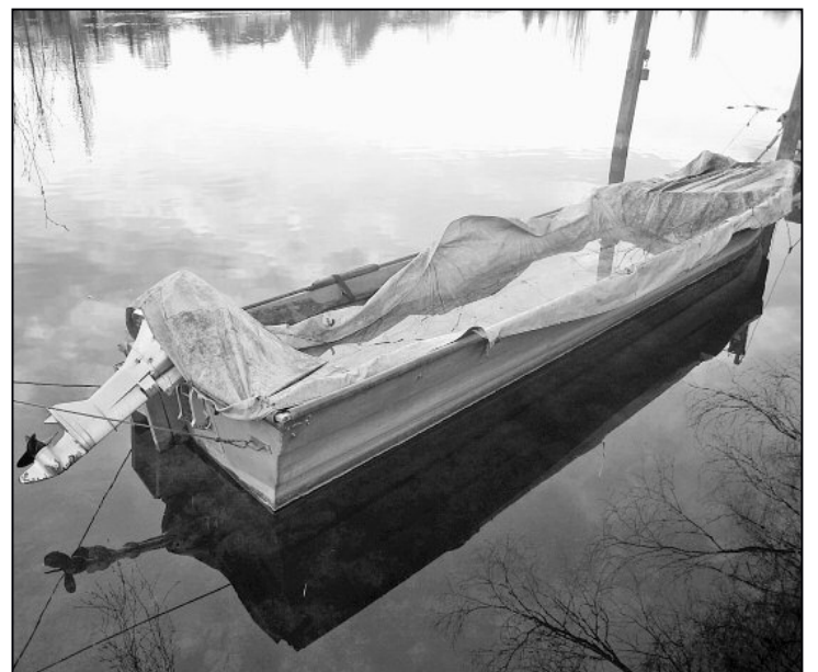
Die Leiden eines Fährboots.

bedächtigt auf dem Wasser treiben. Gepflegt und gehegt erscheinen sie im Frühling nach und nach wieder auf dem Rhein. Die Menschen an Bord sind voller Glück und erfreuen sich am schönen Wetter. Eines ums andere, alle mit dem gleichen Ziel, einen genussvollen Tag zu verbringen. Und ich? Ich bin eines von den wenigen, die am Pfahl hängen bleiben. Wie gerne würde ich meinem Besitzer Freude bereiten. Wie gerne würde ich mit Menschen an Bord über die Wellen tanzen und ihnen die schönen Stellen am Rhein zeigen. Liegt es vielleicht an mir? Bin ich zu alt, zu schwach oder gar nicht attraktiv genug? Wenn ich mich selber anschau, kann ich es ja schon fast verstehen. So mache ich doch wirklich keinem Freude ... Wie gerne würde ich um