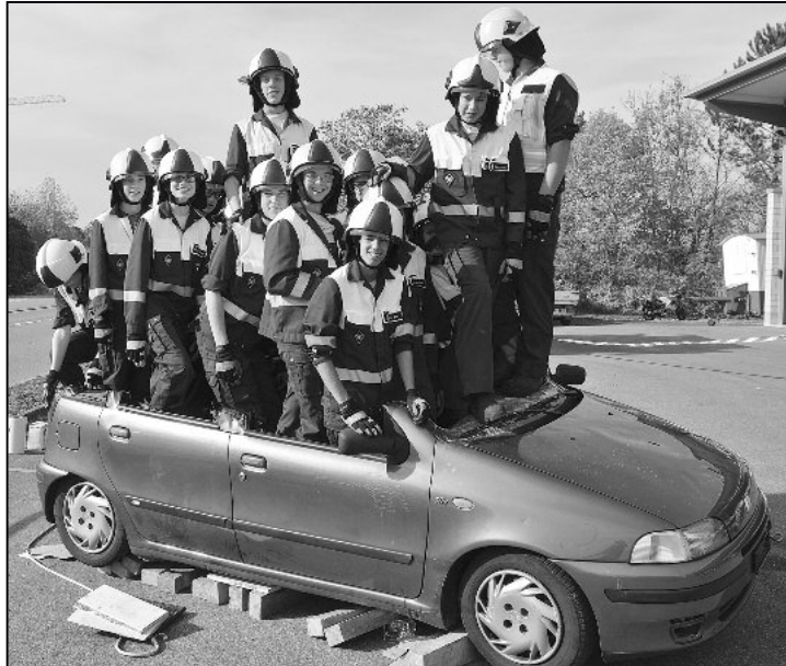
Die Jugendfeuerwehr anlässlich der Schlussübung 2015.