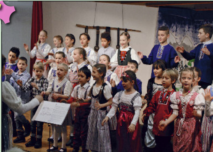
Im Schulhaus Stumpenboden gaben die Schüler der Primarschule einen Einblick in typisch schweizerische Kultur.