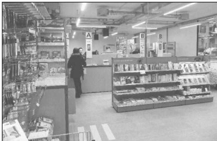
Der grosszügig bemessene Kundenvorraum bietet Platz für die Angebotspräsentation.

sächlich alles! Zu hoffen ist nun, dass diejenigen Kunden, welche das Provisorium gemieden, oder gar nicht entdeckt hatten, wieder zur Feuerthaler Post zurückfinden. Nach dem gelungenen Start ist es tatsächlich wichtig, dass diese Poststelle an zentralster Lage von der Kundschaft rege frequentiert wird