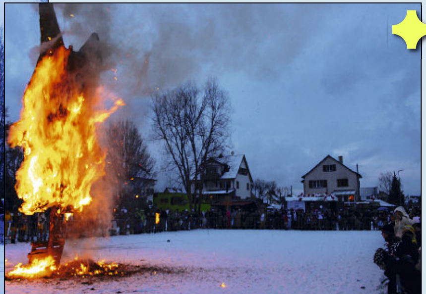
Dieses Jahr liess sich der Böögg nicht zweimal bitten und brach rekordverdächtig schnell in Flammen aus.