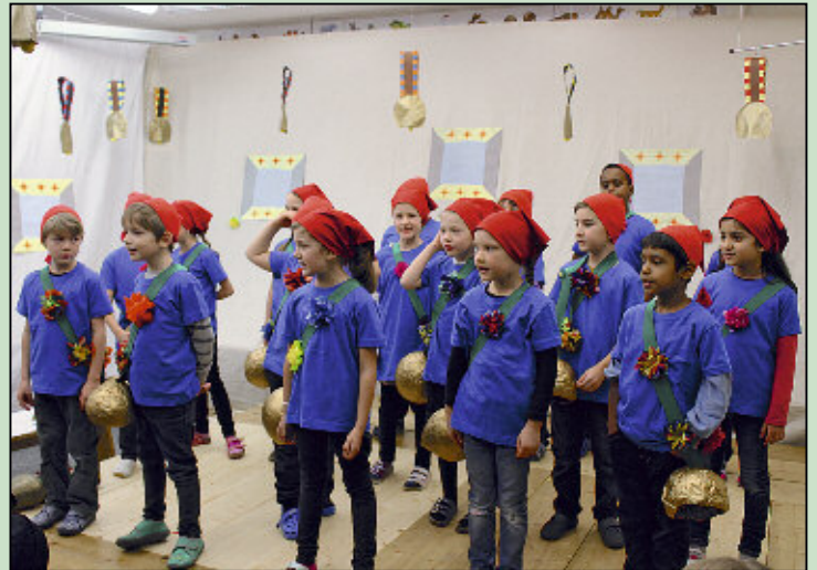
Das Glockenkonzert der Erst- und Zweitklässler entführte die Gäste ins Engadin.