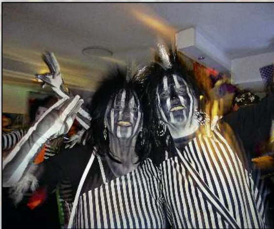
Streifen machen schlank.