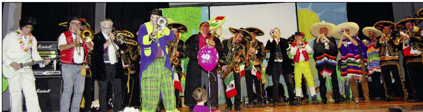
Fast wie in alten Zeiten: ehemalige und aktive Hilarimusiker in Aktion.

In den letzten Jahren fristete der «Weisch no...?»-Ball am Hilari-Freitagabend eher ein Schattendasein. Die gutgemeinte Alterslimite, Besucher mussten über 50 sein, verhinderte ein «altersdurchmischtes» Feiern und so wollte oft nicht so richtig Stimmung aufkommen. Doch in diesem Jahr war alles anders.