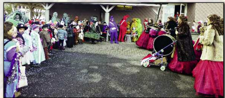
Königinnen konzertierten für die Kinder.