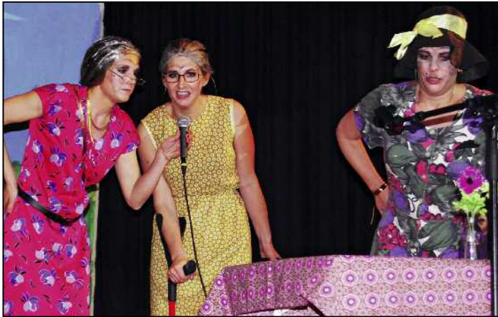
Aus dem Nähkästchen geplaudert: Die Hilariwüiber erinnern sich im Altersheim an ihre früheren Eskapaden.