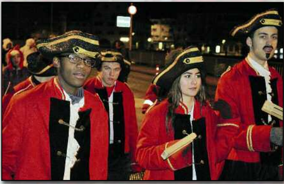
Tagwache: Zu früher Morgenstund durch Wind und Schnee.