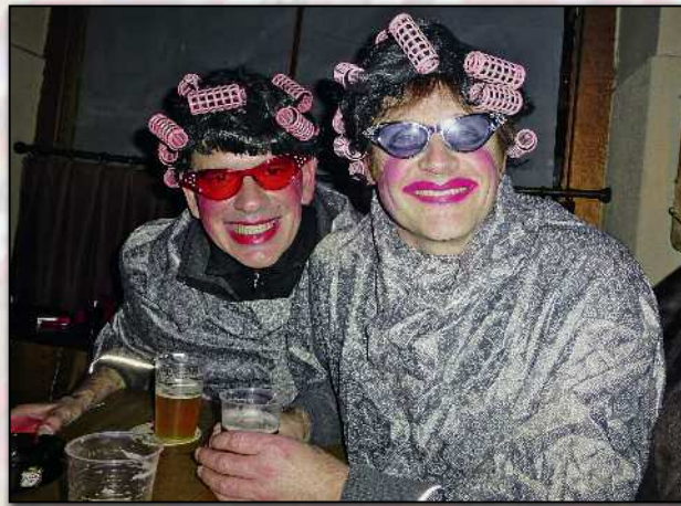
Gambrinus: Mit Lockenwicklern in der Mini-Brauerei.