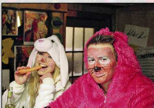
Ruhiger ging es im Dolder 2 zu. Dafür schmeckte die Karotte.