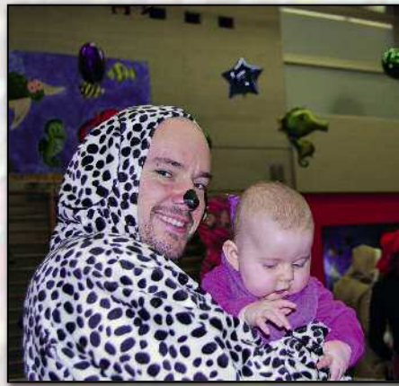
Papi ist der Beste!