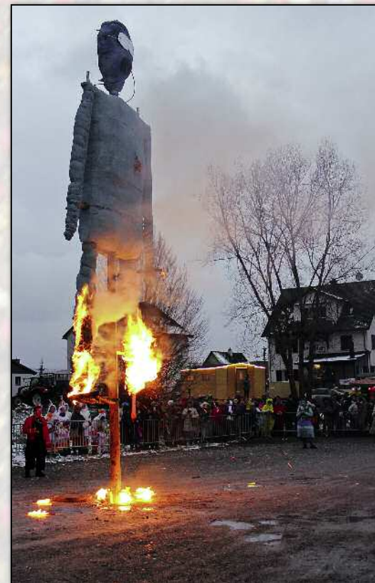
Zuerst schien der Bögg sich standhaft zu wehren...