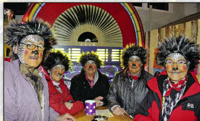
Fünflinge auf der Chuefädlealp.