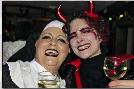
Beim Schällibaum liess man alte Streitigkeiten mal ausser Acht.