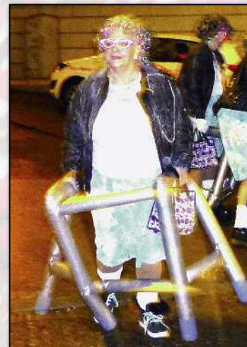
Sicheren Schrittes mit dem Laufböckli auf Tour.