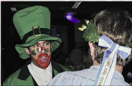
Traditionell ging es im Casa Señores zu.