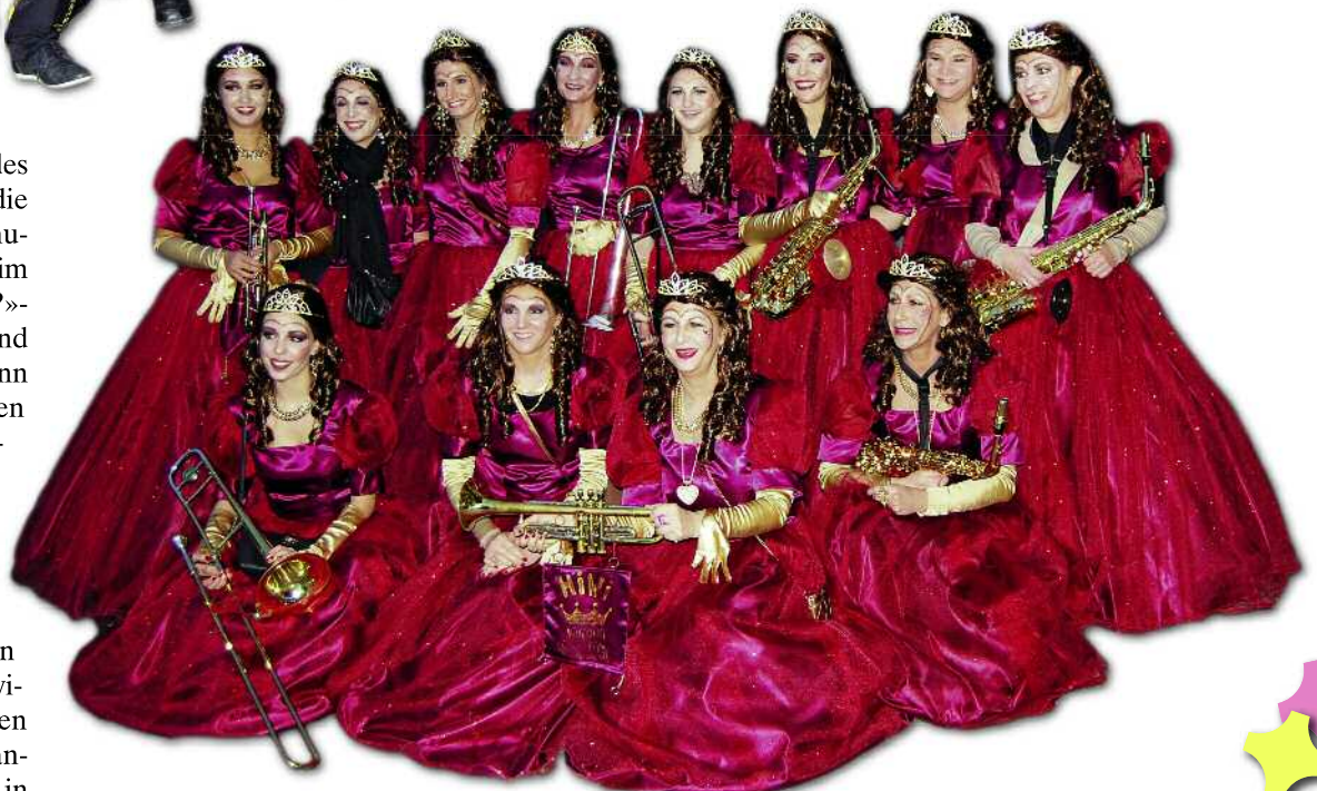
Königinnen der Herzen waren sie schon immer, dieses Jahr noch ein bisschen mehr: Die Hilariwüiber wurden 40!

Die unbestrittenen «Stars» des diesjährigen Hilaris waren die Hilariwüiber und die Hilarimusik. Mit ihrer Jubiläumsshow im Rahmen des «Weisch no...?»-Balls begeisterten sie Jung und Alt. Ihnen gewähren wir denn auch gerne den exklusiven Platz auf der Titelseite und einen Extra-Beitrag über die Jubi-Show auf Seite zwei. Auf den folgenden Seiten nimmt die Redaktion Sie gerne mit auf einen Streifzug durch das Hilarigeschehen des letzten Wochenendes: Zwischen der Tagwache am frühen Freitagmorgen und der Abdankung am Sonntagabend in Langwiesen gab es so manches