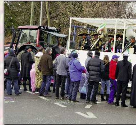
Ohne die Hilarimusk wäre Hilari nicht Hilari.