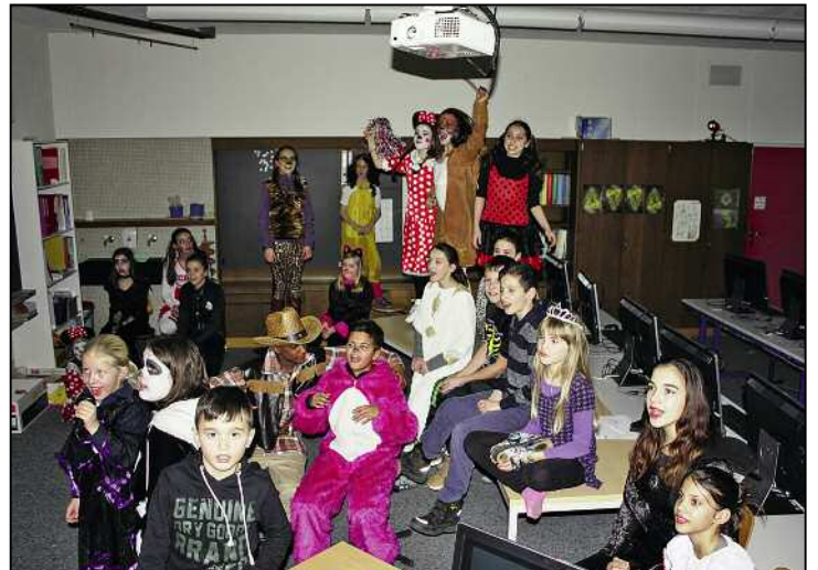
Im Stübli der Mittelstufe war Karaoke angesagt.

Nur noch zwei Tage bis zur Hauptprobe und zur Premiere. Am Montag dürfen die Klassen zum ersten Mal für eine halbe Stunde in die Turnhalle, um auf der grossen Bühne zu