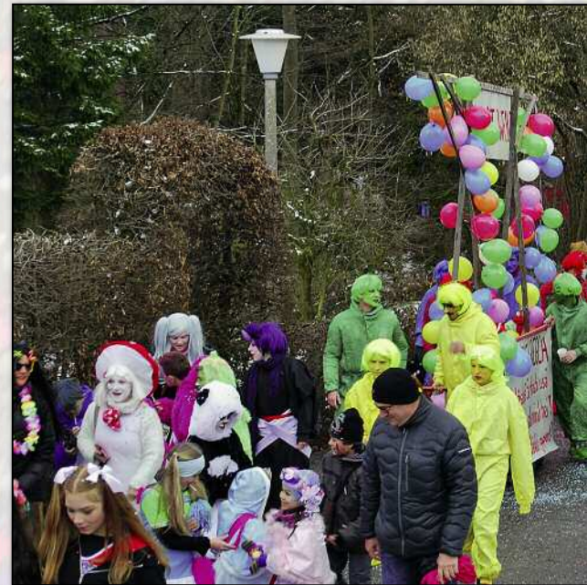
Der Samstags-Umzug erwies sich einmal mehr als farbenfrohes Spektakel.