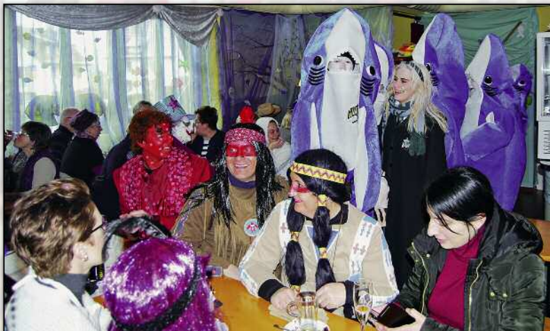
Hai, ai, ai...