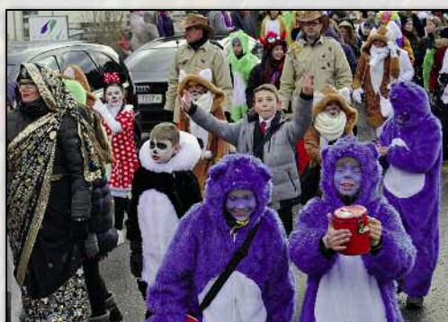
Die blauen Pandas machten Kasse.