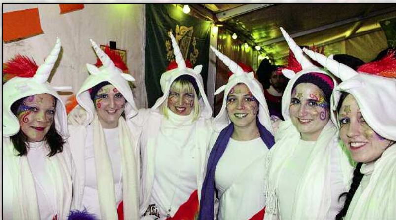
Im Zelt des Langwieser Hilarivereins wurde gar eine Gruppe Einhörner gesichtet.