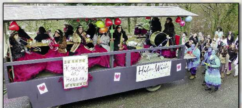
Königinnen on Tour.