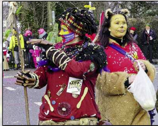
Vor Kurzem noch auf der Bühne von «Lion King» und jetzt am Hilariumzug: Der Affe Rafiki (links).