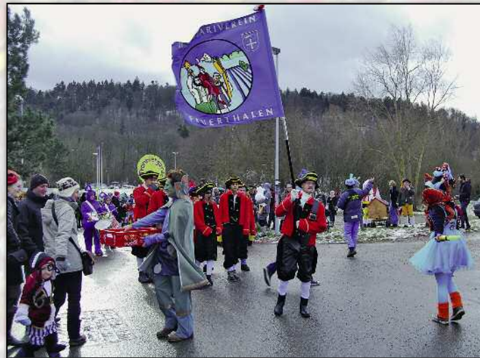
Der Wind machte das Fahmentragen zur Schwerarbeit.