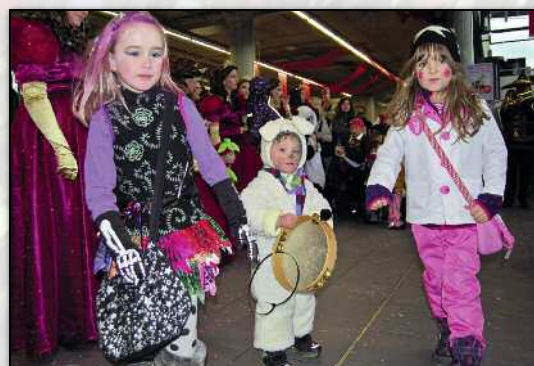
Bald spielen wir selber mit.