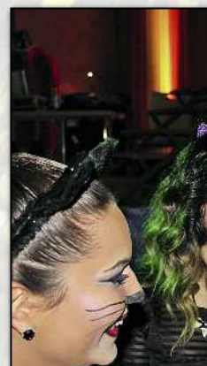
An der Hiliari-Fete ging es wild zu...