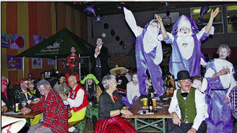
Hai-Alarm auch am «Weisch no...?»-Ball.