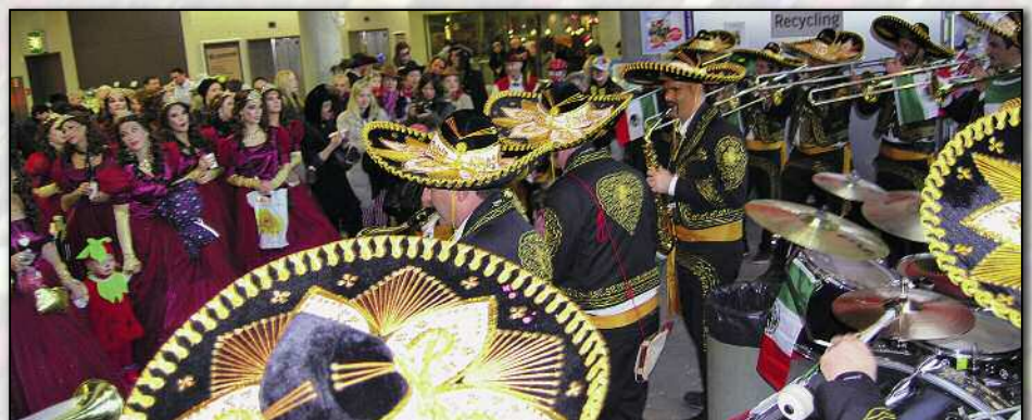
Hilarisound im Coop: Die Hilarimusic spielte für ihre Königinnen und die vielen Fans.