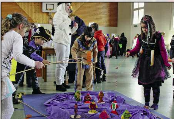
Am Spielnachmittag stellten die Kleinen ihre Geschicklichkeit unter Beweis.