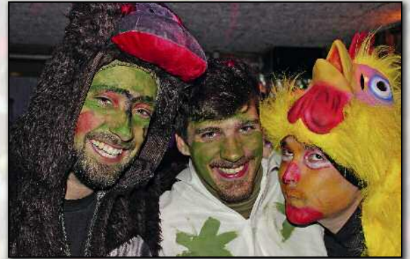
Diese drei Herren beglückten auch den Fotografen mit einer Portion Schminke.