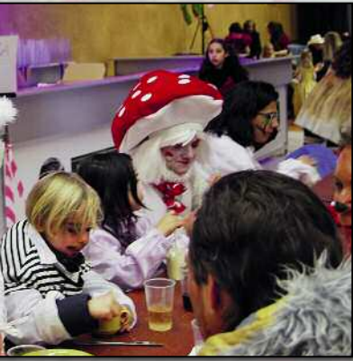
Stärkung vor dem Kinderumzug.