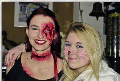
Trotz blutigem Auge immer noch sehr hübsch.