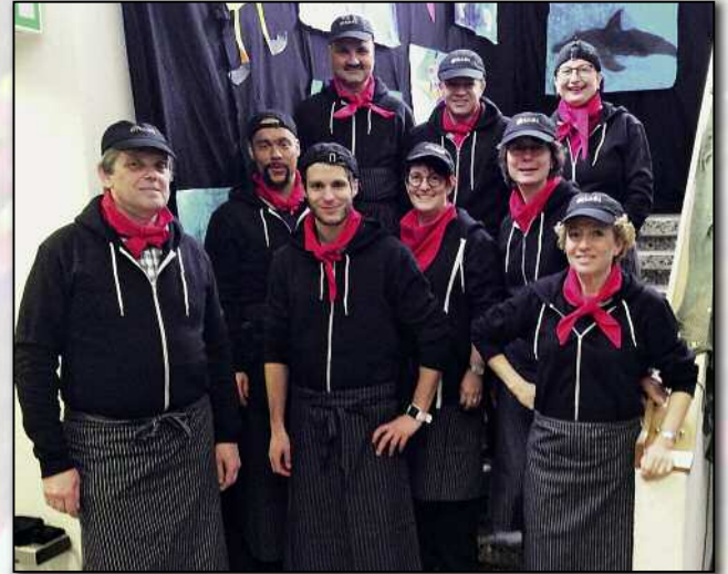
Die Service-Crew der Schulpflege machte einmal mehr eine gute Figur.