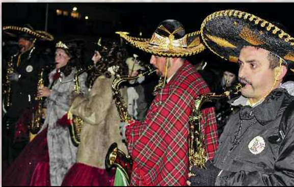
Beim Warten auf den grossen Knall hilft zum Glück Musik.