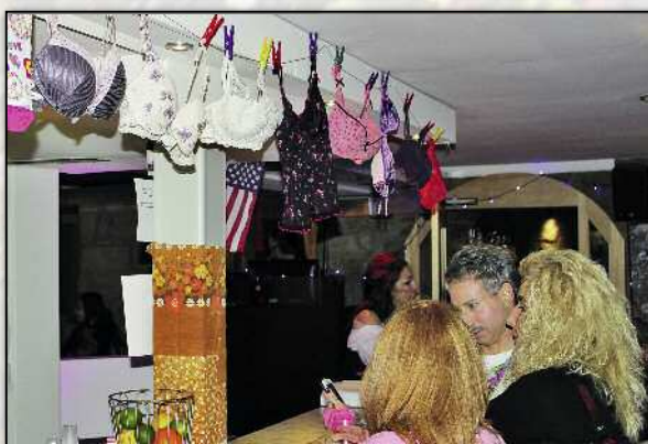
Im Munotblick dinierte man unter Wäsche.