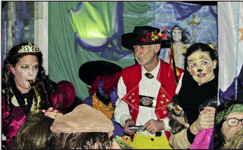
Auch im Schwarzbrünneli wurde wild musiziert.