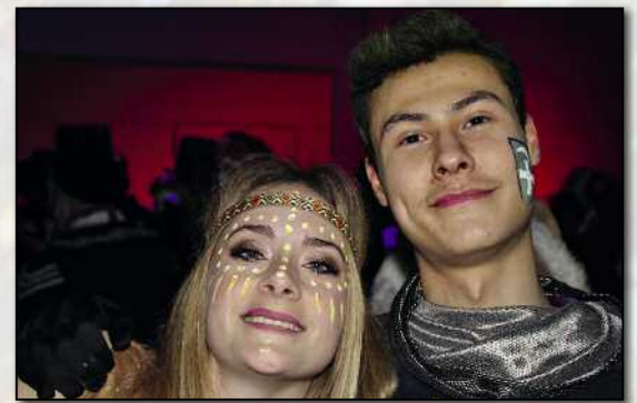
Berta und ihr Ritter nun doch noch vereint?