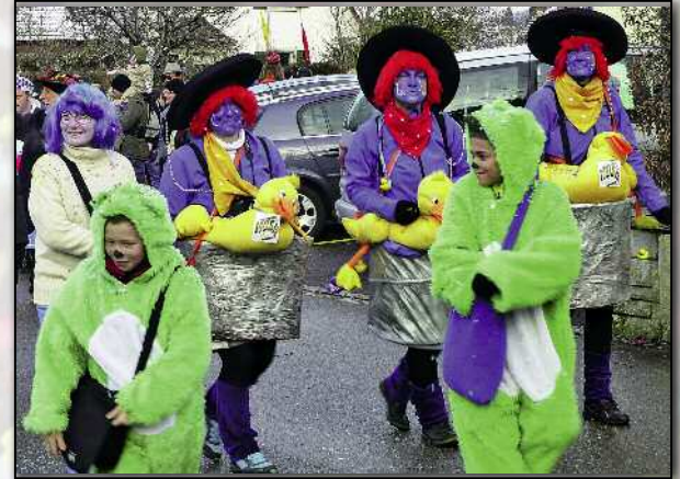
Ententeiche und grüne Pandas.