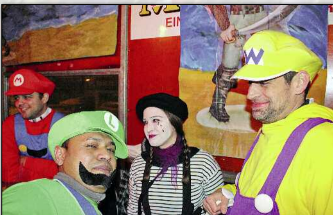
Super-Mario & Co in der Knabenbar.