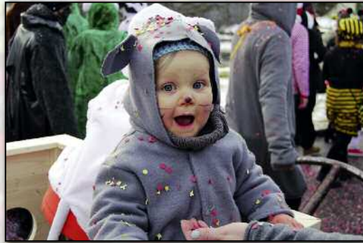
Wenn man aus dem Staunen nicht mehr herauskommt.