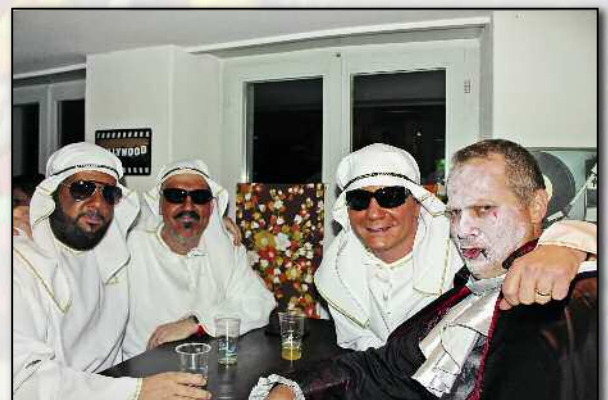
Auch aus Fernost machte man sich auf an den Hilari.