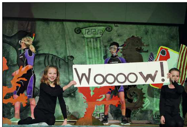
«Wooooow»: Das dachte auch manch ein Zuschauer im Stumpenboden.