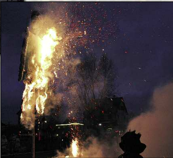
doch zu guter Letzt obsiegt die Flammen!