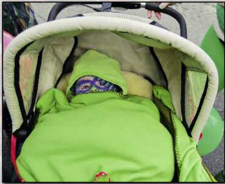
Kleiner Bankräuber oder kleiner Hilarivogel?