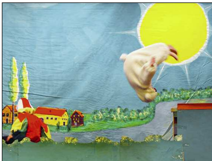
Ein gekonnter Sprung im Schafskostüm.

Für viele Hilari-Teilnehmer begann der diesjährige Hilari mit einem Besuch der Theateraufführung im Stumpenboden. In vielen kleinen Auftritten wurden die Gäste in die unterschiedlichsten Unterwasserwelten entführt.