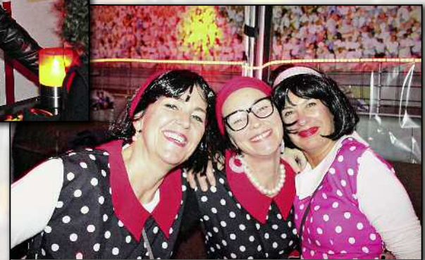
... aber auch die Damen amüsierten sich prächtig.