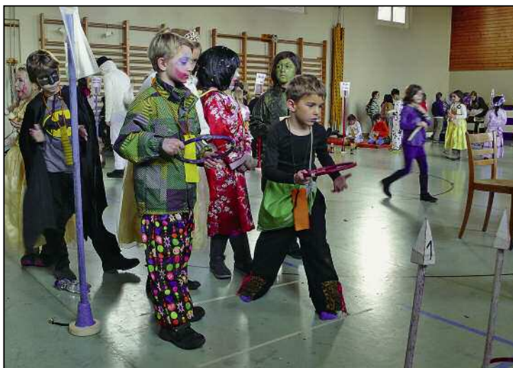
Am Spielnachmittag der Unterstufe konnten die Kinder an 16 Posten ihre Geschicklichkeit beweisen.