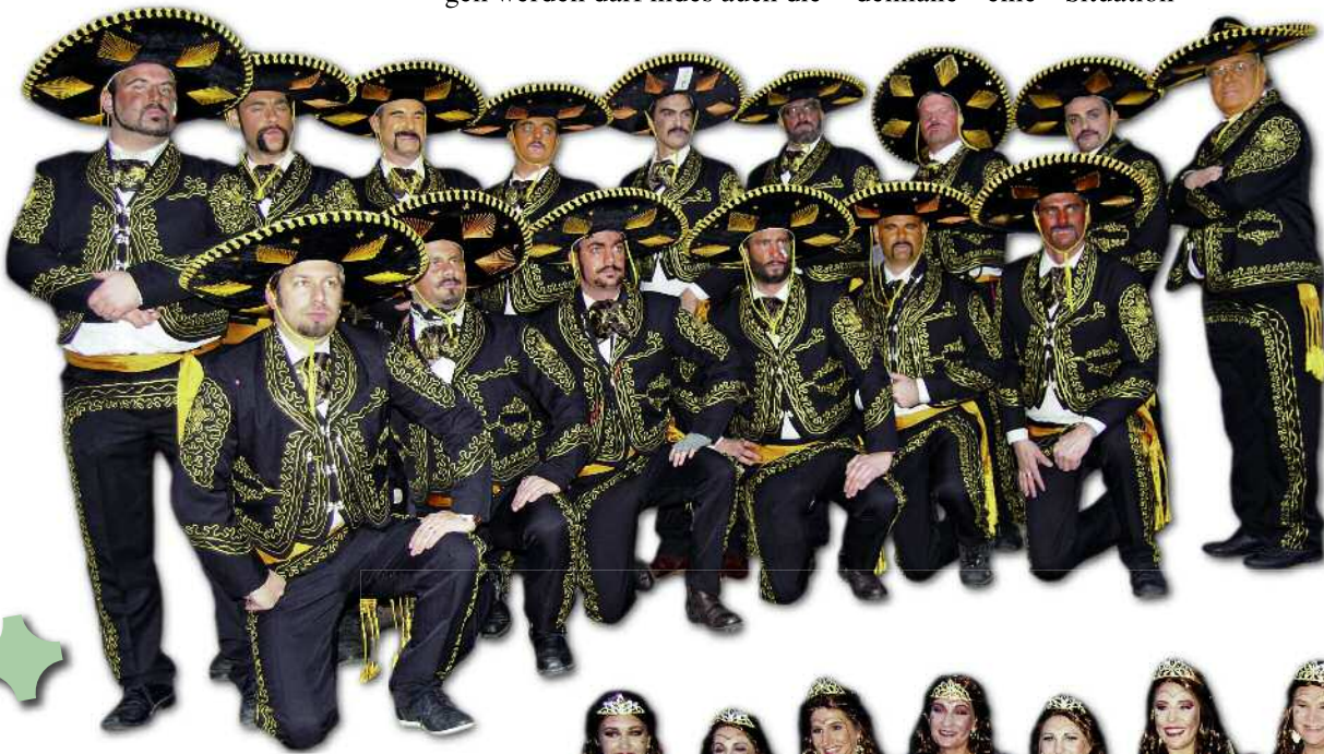
Olé – 60 Jahre Hilarimusik!