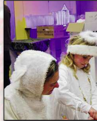
Mittagessen in der Halle: Eine letzte