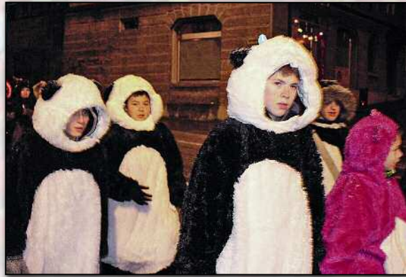
Morgenstund hat Gold im Mund. Ob das auch für Pandas gilt?