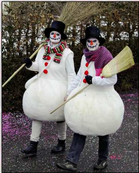
Diese Schneemänner schmolzen nicht.