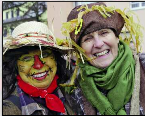
Vogelscheuchen unter sich.