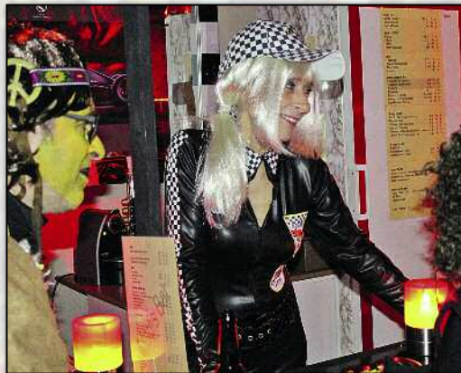
In der Madisbar durften sich vor allem die Männer heimlich freuen...