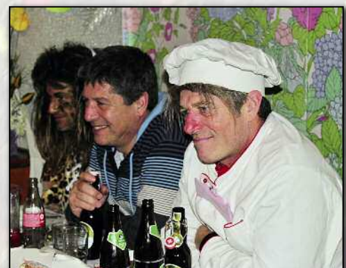
Im Engel gönnte sich auch ein Koch ein paar Gläser.