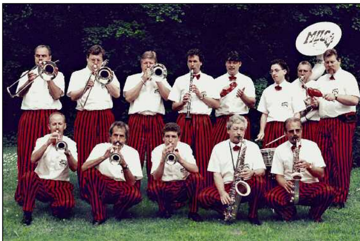
Die Hilarimusk präsentierte 1994 ihre erste CD «Premiere».

Natürlich ist nach diesem Jubiläum nicht Schluss, der Feuerthaler Anzeiger hat auch nach