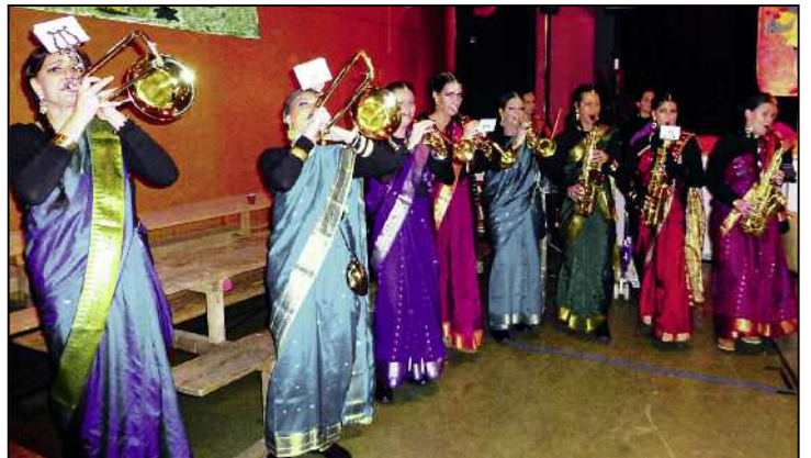
Sehr schön und sehr laut. Die Hilariwiiber traten am Hilari 2013 als Inderinnen auf.

Aber zuerst lassen wir die Hilariwiiber und die Hilarimusk ihr gemeinsames 100-Jahr-Jubiläum gebührend feiern, der Feuerthaler Anzeiger gratuliert dazu herzlich!