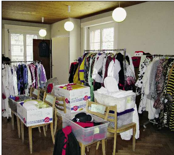
Die Kostüme und Requisiten der Hilaribörse suchen ein neues Zuhause.

Das Turnhallenzimmer des Schulhauses Spilbrett bot sich als Standort für die Börse geradezu an, war es doch gross genug, um die Kostümschränke, welche Eigentum des Frauenvereins sind, zu beherbergen.