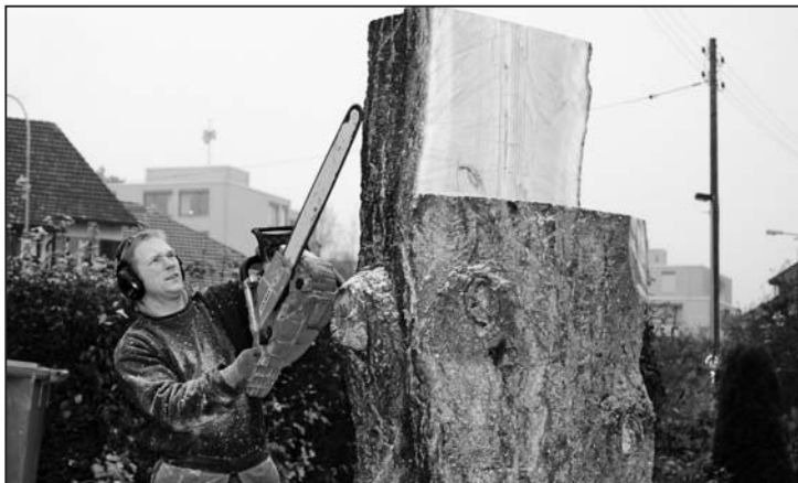
Noch ist von den Eulen nichts zu sehen ...