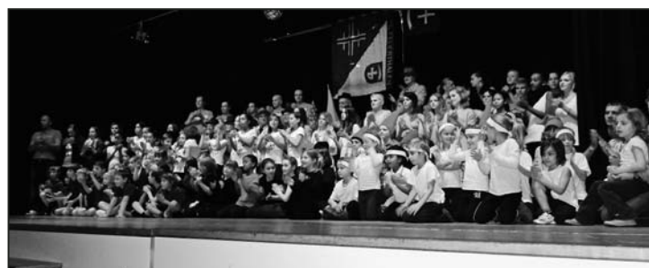
Die Bühne war fast zu klein für alle Tänzer, Turner und Akrobaten.

Einig war sich die Jury auch bei der Tanzaufführung des Chartstürmerhits «Gangnam Style» des Jugendturnens, denn diese Darbietung überzeugte niemanden, und daher folgte das Aus für die drei männlichen Tänzer. Viele Lacher und schüttelnde Köpfe des Publikums unterstützten diese Entscheidung. Nach den erfolgreichen Auftritten des Muki-Turnens und der «Mädchenriege gross»