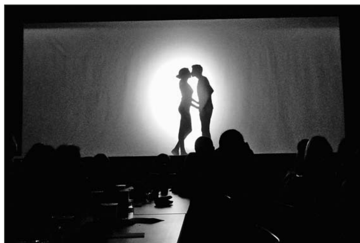
Romeo und Julia – hinter der Schattenwand ging es leidenschaftlich zu.

Alles in allem war es für die turnenden Vereine ein erfolgreicher Abend, der den Zeitgeist widerspiegelte und auch den grössten Teil der Geschmäcker traf. So blieb man gerne noch ein wenig sitzen und tauschte sich über den spannenden Abend aus.