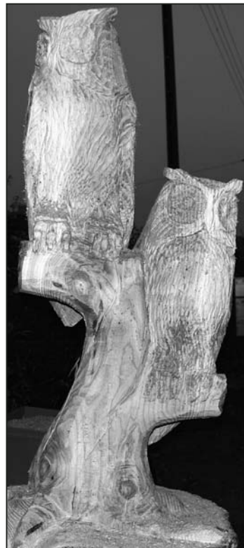
... abends: geschafft! Die beiden Eulen sitzen stolz auf ihrem Ast.

cherheit sein, arbeitet man doch mit der nicht ganz leichten Motorsäge mehrere Stunden. Einen Tag brauchte der Künstler, bis seine beiden Eulen fertig aus dem Stamm herausgearbeitet worden waren. Das Ergebnis kann sich nicht nur sehen las-