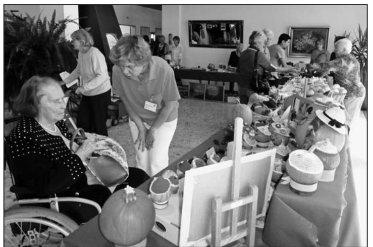
Wer die Wahl hat, hat die Qual.