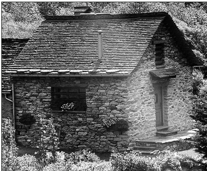
Das Tessin hat noch mehr zu bieten als Rustici.