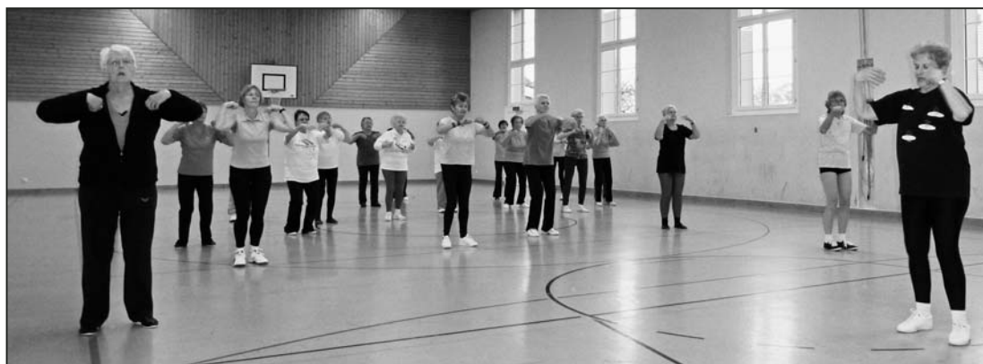
Hier wird einem warm, nicht nur in den Gelenken.

Was mit dem gewonnenen Geld gemacht werden soll, wird demnächst gemeinsam beraten. Ob die Anschaffung neuer, spezieller Turngeräte finanziert werden soll, oder ob man sich lieber einen gemeinsamen, gemütlichen Ausflug gönnt, darauf darf man gespannt sein.