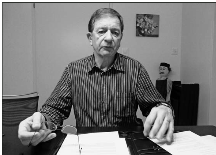
«Einigen ist der Sonntagsgottesdienst zu früh und der Abendgottesdienst zu spät.»

ich finde Gott in der Natur ... unmoderne Musik und Lieder ... den Menschen wird immer gedroht ... in der Kirche sind zu viele Heuchler, die nur am Sonntag brav tun ... für meinen Glauben brauche ich die Kirche nicht ... ich kannte einen Pfarrer, der ... die Kirche sagt mir nichts, usw.»