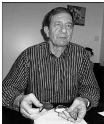
«Ich könnte mir auch einen anderen Beruf vorstellen ...»

Wie stellt sich ein Pfarrer eigentlich den lieben Gott vor? «Es heisst zwar im zweiten Gebot, wir Menschen sollen uns kein Bild von Gott machen, und doch tragen wir wohl alle unser Gottesbild mit uns. Gott gleicht für mich einem riesigen Puzzle mit unzähligen Teilen. Ein paar davon sind mir bekannt und ich kann sie beschreiben. Darunter sind schöne und angenehme Teile, aber auch solche, mit denen ich grosse Mühe habe. Er ist genauso und dann noch ganz anders ... Es wäre vermessen zu sagen, dass ich das Bild