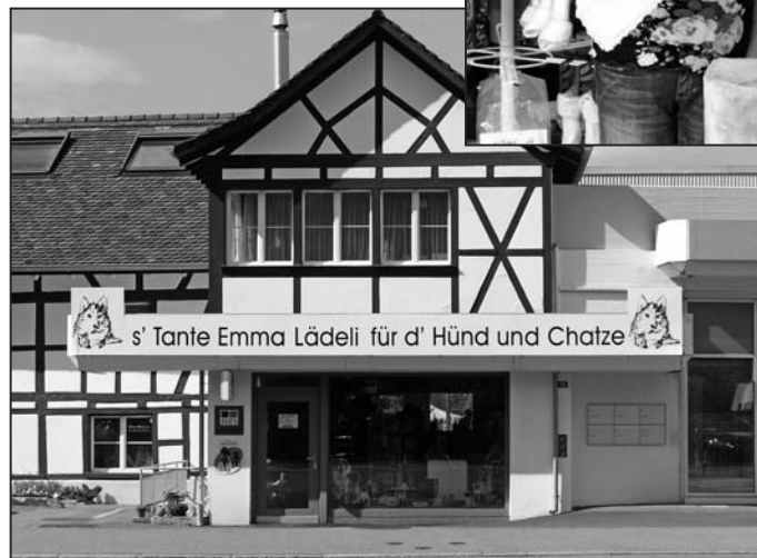
Das Tante-Emma-Lädeli ist bald Vergangenheit.

Seit mehr als zwanzig Jahren ist das sympathische Lädeli im Gewerbehaus neben der Gara-