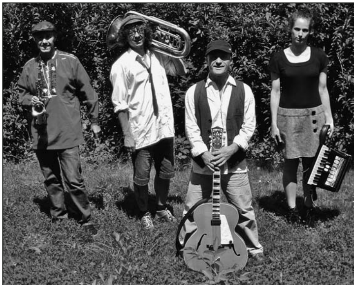
Vielfältiges Quartett: Die «Fiehlfähltigen».