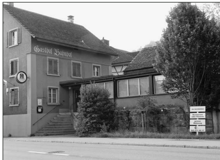
Endzeitstimmung und Nachmieter-Suche im «Bahnhöfli» Langwiesen.

Vielleicht, und das wäre toll, gibt diese Geschichte einigen Dorfbewohnern einen Denkanstoss, sich für die Dorfgemeinschaft künftig wieder vermehrt einzusetzen.