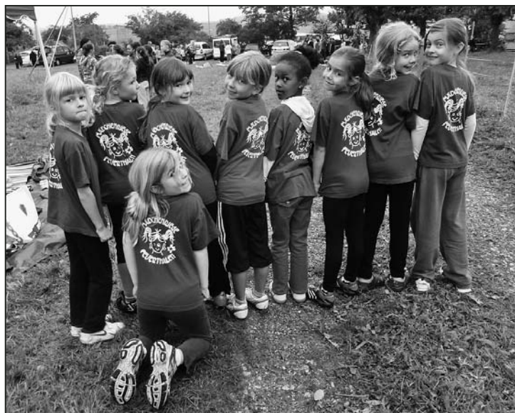
Haben wir nicht coole Leibchen?

Nach der Rangverkündigung erkämpften wir uns einen Platz im völlig überfüllten Bus nach Schaffhausen. Weil der Bus so