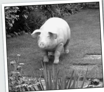
Wer stellt hier wohl sein Sparschwein in den Garten? Nun, zum Mitnehmen ist's sicher eh zu schwer.