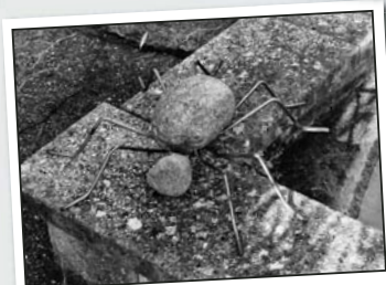
Spinnen sind Geschmackssache – diese nicht.