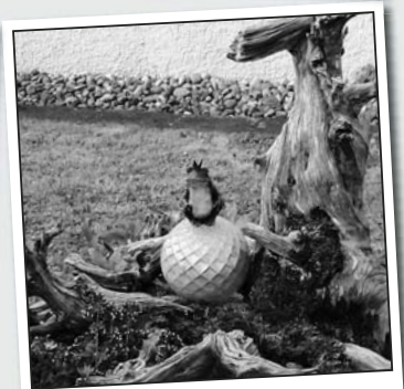
Stilleben mit Froschkönig.