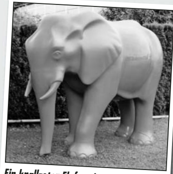
Ein knallroter Elefant im Garten, wo gibt's denn das? In unserer Gemeinde natürlich.