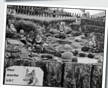
Es gibt sie also doch noch, die guten alten Gartenzwerge. Hier haust sogar eine ganze Sippe und diese ist so selten, dass sie Tag und Nacht bewacht wird.