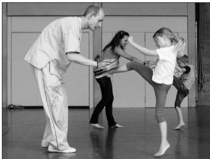
Tricks und Kicks vom Kampfsportleiter.