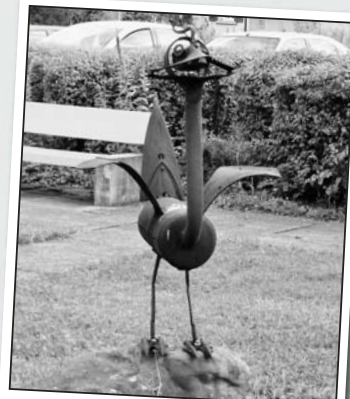
Vogel oder Oklahoma-Grill? Das ist hier die Frage.