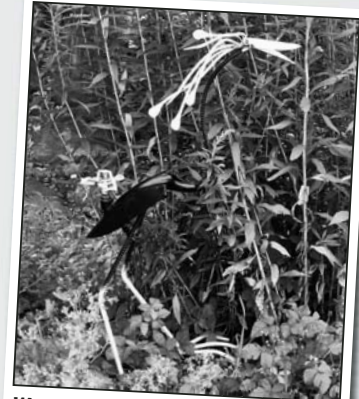
Wenn sich eine Kiesschaufel mit Armierreisen paart, dann entsteht dieser Schaufeleisenvogel und den sehen Sie weltweit in keinem Zoo.