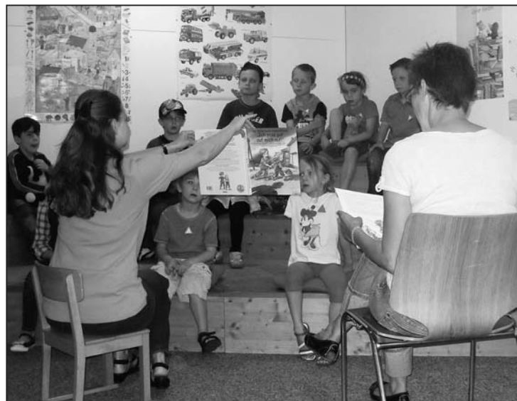
Wie reagiere ich, wenn ich von jemand Fremden angesprochen werde?

Kinder) und Kinder-Mutmach-Theater durchführt ( www.kindertheaterkurse-schaffhausen.com ).