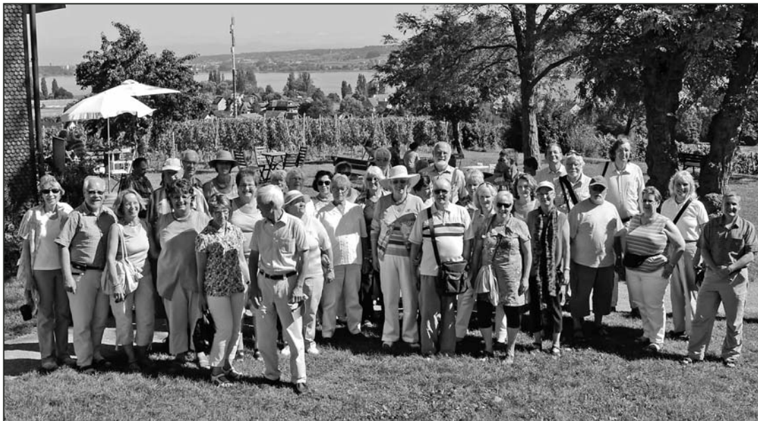
Frieren musste niemand: Die Reisegruppe in der heissen Hochsommer-Sonne.

Mit Bahn, Schiff und Doppeldeckerbus ging es auf und um die Insel herum. Die Insel Reichenau ist zehn Mal grösser als die Insel Mainau und die grösste Insel im Bodensee. Sie ist 4,5 Kilometer lang und nur 1,5 Kilometer breit. Die Reichenau ist bekannt für ihren Gemüse- und Salatbau, denn hier ist es zwei bis drei Grad wärmer als auf dem Festland, und dies ermöglicht so bis zu dreimalige Ernteerträge pro Jahr. Die vier wichtigsten Einnahmequellen waren schon seit jeher der Gemüse- und Weinbau, der Fischfang und die Pilger, was bis heute so geblieben ist, denn aus den Pilgern wurden die heutigen Touristen. Die Bewässerung des Anbaus erfolgt über 60 Kilometer lange Leitungen, die von beiden Seiten der Insel aus dem Bodensee zu den Anlagen führen, weswegen die Insel oft auch Insel der 1100 Springbrunnen genannt wird. Die Insel verfügt über eine einzigartige Landschaft und atemberaubende Aussicht auf den ganzen Untersee. Die höchste Stelle der Insel befindet sich auf dem Aussichtspunkt der «Hochwart» und liegt auf 440 Meter über Meer. Von hier aus kann man verschiedene Orte bewundern wie den Seerücken auf Schweizer Seite, Schloss