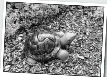
Schildkröten sind gaaaanz langsame Tiere. Diese hier ist aus Keramik und steht sogar immer an der gleichen Stelle.

Der private Garten – früher uneingeschränkt das Revier der Gartenzwerge – wird heute von ganz anderen Bewohnern in Beschlag genommen. Ein unterhaltsamer Streifzug mit der Kamera durch die Gärten unserer Gemeinde: