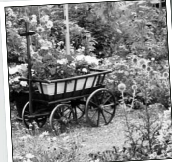
Wurde hier einer beim «Blumenabzügeln» überrascht?