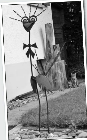
Ob sie wohl angreifen soll? Die Katze im Hintergrund überlegt sich dies besser nochmals.