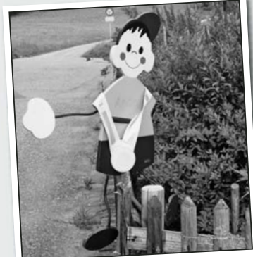
Der freundlich lachende Knirps begrüßt alle Vorbeifahrenden und erinnert sie daran, dass im Quartier auch Kinder wohnen.