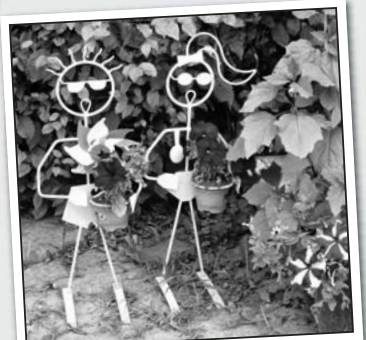
Das Blumenkinderpärchen ist eindeutig auf Sonne eingestellt. Ob die zwei im Winter auch noch da stehen?