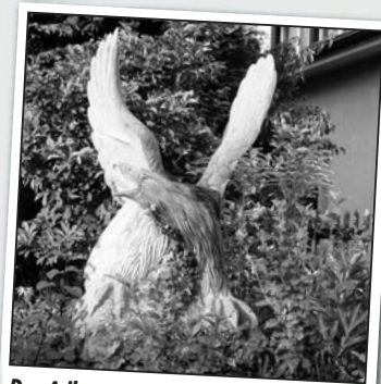
Der Adler ist gelandet!