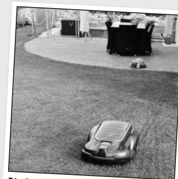
Die Familie ist in den Ferien – er bleibt zu Hause: Einsam zieht dieser treue Rasenmäher seine Bahnen, damit sich alle am schönen Grün erfreuen können, wenn sie nach Hause kommen.