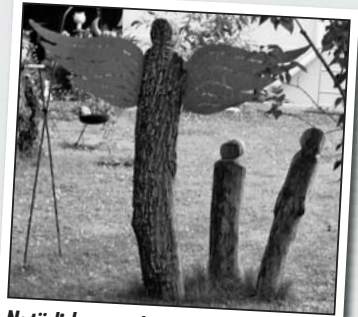
Natürlich gewachsene Kunst: Engel mit und ohne Flügel.