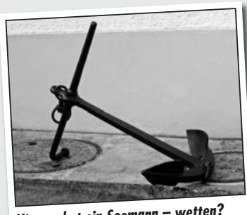
Hier wohnt ein Seemann – wetten?