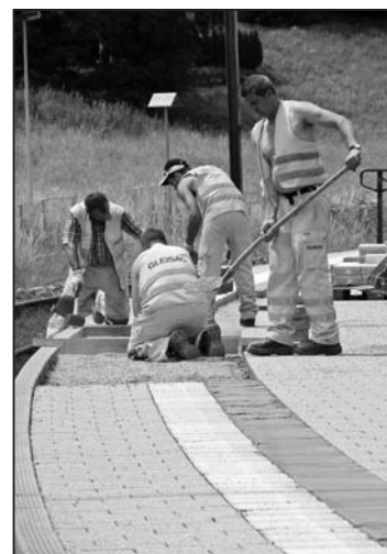
Männer vom Bau sympathisch und schlau.