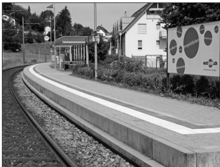
Neue Sicherheitslinie in elegantem Bogen.

sehr unter Witterungseinflüssen und Wintersalzstreuung gelitten. Ein zum Stolpern verführender Sicherheitsstreifen machte optisch dazu noch einen vergammelten Eindruck. Am Montag, den 18. Juni traf eine Rotte von sechs Mann der GLEISAG aus Goldach in Langwiesen ein und baute innerhalb von drei Tagen die desolaten Bodenplatten aus und neue wieder ein. Die neue blendend weisse Sicherheitslinie ist nun mit Rillen versehen – eine Verbesserung, die auch für Behinderte von Vorteil ist. Bravo, Thurbo!