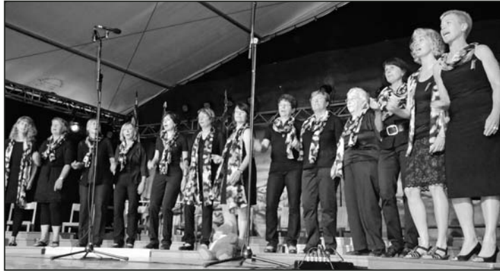
Die Feuerthaler Sängerinnen rissen das Publikum mit.

Tags zuvor hatten die SängerInnen unter tropischer Hitze gelitten (38° in der Dorfkirche). Die anhaltenden und heftigen Gewitter brachten in der Nacht die ersehnte Abkühlung. Die Herren des Büsinger Männerchors hatten mit schwierigen Wetterbedingungen zu kämpfen. Sie bedeckten den Zugang zum Zelt, das auf einer Wiese stand, mit Stroh und Brettern, damit