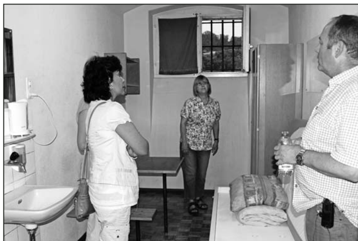
In einer Gefängniszelle merkt man nichts von Wellnesshotel.