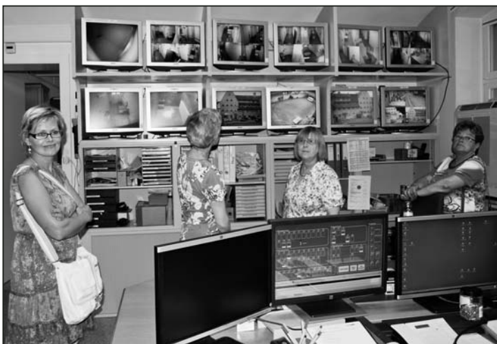
Totale Überwachung in der Gefängniszentrale.